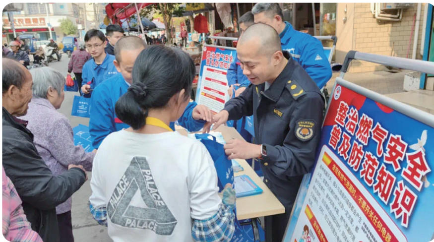
肇庆县城管局工作人员向群众普及燃气安全知识