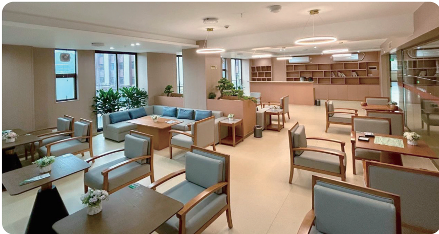
多元化社交空间

配,芊草堂餐厅采用当地新鲜有机食材,结合中医养生理念制定膳食菜单,提供营养美味餐食满足营养需求;另一方面,药王谷康养酒店内有多种住宿选择,房间温馨舒适设施齐全,部分还有独立泡池,既能享受养生服务,又可获得良好的休息环境。