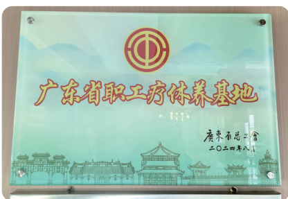
2024年被评为广东省职工疗休养基地

据悉,佛冈药王谷康养中心凭借优越的环境、丰富的配套以及专业的服务态度,在2024年广东省职工疗休养基地服务工作经验交流活动中,被正式评定为广东省职工疗休养基地。