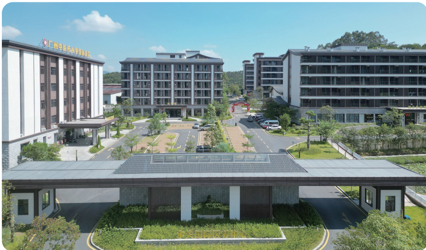
佛冈药王谷康养中心