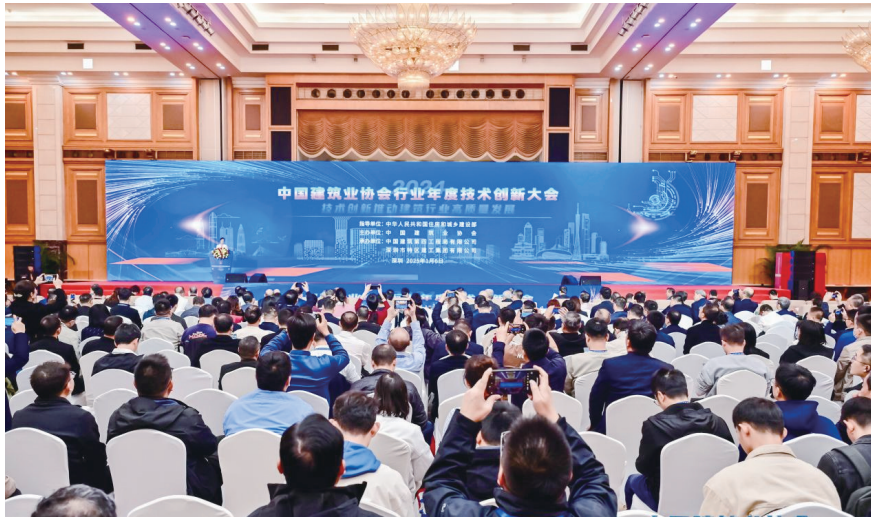
会议现场

住房和城乡建设部党组成员、副部长姜万荣在会上提出了当前建筑业的新形势、新任务、新要求，并鼓励建筑业企业要坚定信心、迎难而上，加快转型升级发展，努力开创行业高