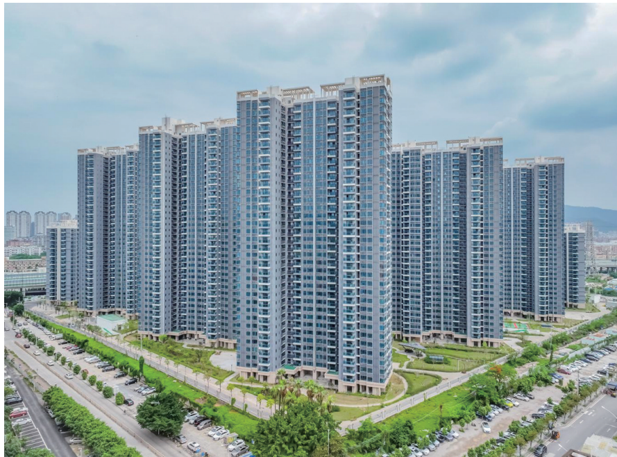
截至目前，珠海市安居集团供应各类配租型保障性住房约1.25万套，保障了各类住房困难群体需求。图为安宜花园。

走进悦园保障房项目部，令人意外的是，与平日所见装备相对齐全的建筑工地临时办公室不同，四面白墙、两张桌子、一个床铺构成了这个珠海市重点保障房项目建设的“总指挥”“总基地”。就是这样，珠海市安