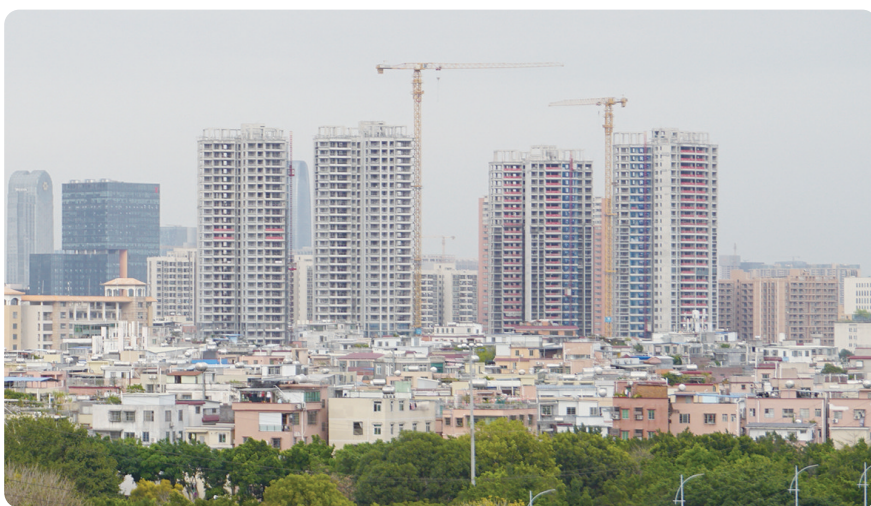
会议要求加紧谋划储备城市更新项目,强化城市更新项目入库、监督、退出管理。

会议强调,要按照国家及省的部署要求,把城市更新项目谋划申报工作与城市更新“十五五”专项规划编制结合起来,认真总结“十四五”时期城市更新行动实施情况,提出未来五年城市更新主要目标、重点任务、重大工程项目,抓好“财、债、贷”协同,加快谋划近三年城市更新重点领域项目,积极争取各类资金,增强工作的整体性、系统性、连续性。