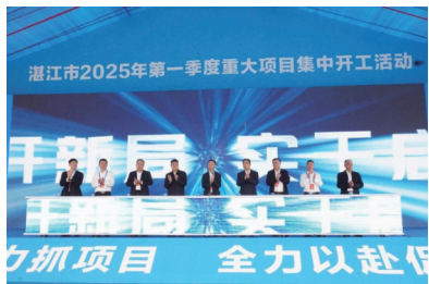
集中开工仪式现场

广东建设报讯 3 月 28 日，湛江市 2025 年第一季度重大项目集中开工活动在麻章区主会场隆重举行，10 个县（市、区）分会场同步联动，总投资超 342.3 亿元的 115 个重大项目全面破土动工。市委书记余钢宣布开工令，市委副书记、市长李勇毅致辞，省市相关部门领导、企业代表及社会各界嘉宾共同见证这一重要时刻。