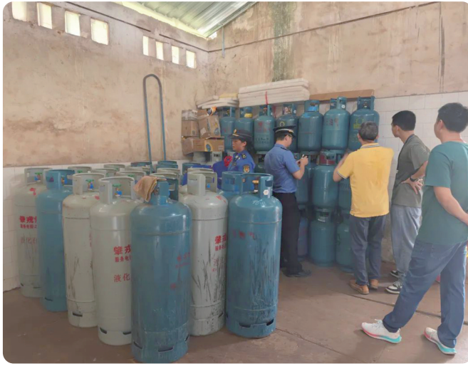
废弃房屋暗藏“黑气”加工链

据调查，违法行为人为肇戎燃气公司南陈服务点送气工，所有气瓶均由其从肇戎气站充装后运至该处储存，并在房间内实施过气行为。违法行为人对非法储存及过气的行为供认不讳，并现场指认过气工具及演示过气流程，现已移送公安机关依法处理。