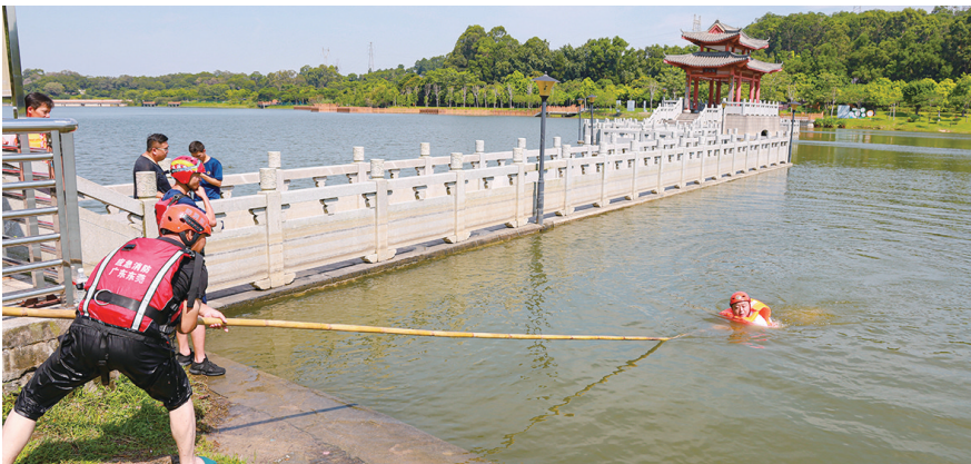
厚街城管联合消防开展防溺水救援实战演练

此次演练采用“一期多员”模式，分批次对辖区公园与碧道安保骨干力量进行系统化、实战化轮训。培训聚焦实战需求，内容扎实丰富。在理论教学环节，镇消防大队专业救援人员围绕溺水事故识别、预防措施、装备使用、团队协助以及救援技巧等核心救援知识进行讲解，并强调溺水事故往往发生得非常迅速，因此每个人都应该掌握基本的自救和互救技能。