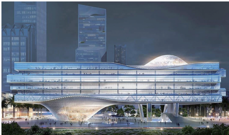
引领第四代商业文明——粤靓湾广场规划图

在此基础上，同为粤靓集团全资子公司的广东广筑建设有限公司，专注于将设计蓝图转化为精品工程。该公司持有二级装饰装修及劳务资质，主营房屋建筑工程施工、室内装饰装修及装饰石材零售等。其恪守“客户第一、服务至上”理念，将“重合同、守信用”融入经营血脉，平衡经济效益和社会效益。通过推行科学管理、倡导绿色施工与建筑节能，积极践行装配式装修与内装工业化，不断完善质量管理体系，致力于打造行业标杆工程。该公司参与的众多大型项目，已成为推动城市焕新的有力见证。