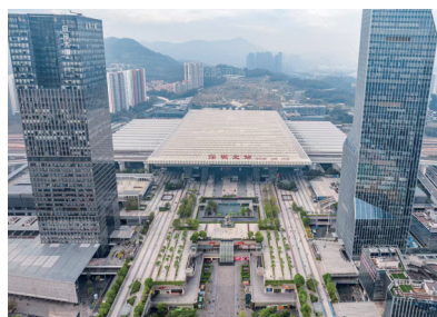
石材资源开发与深加工工程案例——深圳北站

其卓越实力已获众多重大工程印证：深圳北站、深圳福田站、沈阳南站、武汉天河机场、成都天府机场等重大交通枢纽，郑州、长春等城市地铁网络，以及佛山禅城中心医院、苏州世博项目、泰州茂业等遍布全国的地标性工程，均大量采用了日仙石材提供的优质“芭拉白”等产品。这份覆盖全国、服务重大工程的履历，彰显了其在石材供应领域的重要地位。