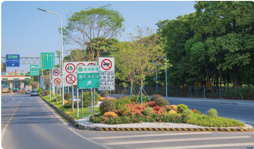
黄石北高速收费站入口退缩空间，打造植物组团种植点。

此外，白云区域管局将黄石北高速收费站入口绿地、兵房街南端绿地等高架桥底以及高速路出入口的8处退缩空间，打造成具有地域特色的植物组团景观，营造全运迎宾氛围。其中，作为植物组团景观的代表性作品，机场高速黄石北出入口的改造彰显了“动态美学”：2600平方米的绿