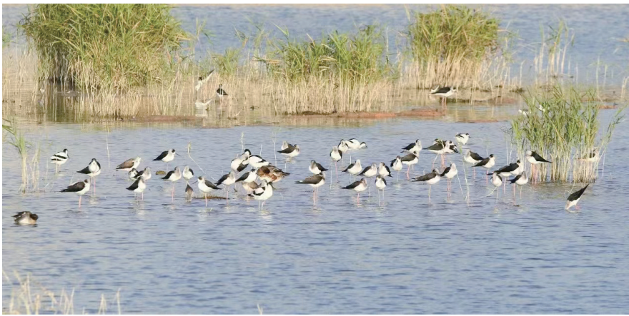
我省广阔的滨海湿地及丰富的食物资源，为候鸟提供了适宜的栖息环境

据悉，广东海域辽阔，滩涂广布，陆架宽广，港湾优良，大陆海岸线长4114千米，居全国首位，拥有多样的自然生态系统和丰富的候鸟资源。据统计，全省历史记录有野生鸟类584种，其中具有迁徙属性鸟类412种，占70.5%，包括中华秋沙鸭、白鹤、小青脚鹬、遗鸥、东方白鹳、黑脸琵鹭、黄胸鹀等23种国家一级保护野生鸟类。 广东红树林面积达1.14万公顷，位居全国首位。广阔的滨海湿地及丰富的食物资源，为候鸟提供了适宜的栖息环境，是候鸟迁徙的理想家园。海丰湿地、惠州大亚湾和考洲洋沿海湿地、珠江口湿地、深圳湾湿地等地，每年都有数十万只候鸟抵达过冬，仅仅珠江口湿地就有10万只以上的候鸟。据估计，今年秋冬途经广东迁徙的候鸟预计超30万只。