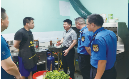
检查餐饮场所用气情况，向用户宣传用气安全知识。