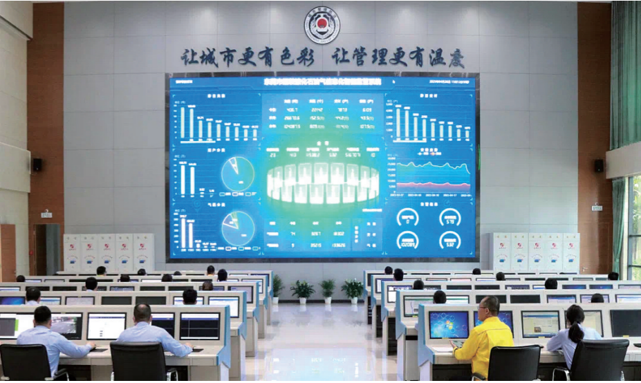
东莞市瓶装液化石油气智能监管平台

（一）强化企业主体责任，构建智慧监管体系。一是完善瓶装气智能监管系统，全面应用联联控枪、智能角阀、二维码标识等技防手段，构建“充装—运输—配送—用户”全生命周期可追溯系统，实现每只气瓶“来源可查、去向可追、责任可究”。整合气瓶充装、运输车辆、配送人员、用户信息等数据，运用大数据分析实现智能预警，提升监管精准度。二是推行“一户一卡”实名制登记，详细记录用气地址、设备信息、安检记录等数据，为精准监管提供支撑。三是规范配送服务管理，统一配送车辆标识、人员着装、服务标准，强制使用符合标准的“六统一”电动配送车，安装GPS定位系统，实时监控配送轨迹。四是深化“安检+宣传”模式，组织燃气企业、执法人员、网格员、物业公司联合入户，同步提供用气设施更新、安全隐患整改等一站式服务。 （二）完善信用监管机制，建立行业退出制度。构建以信用监管为核心的新型监管机制，推动行业优胜劣汰。一是根据《东莞市燃气行业信用评价管理办法》，实施分级分类监管。二是建立