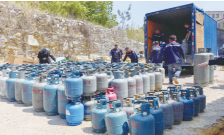
东莞市镇街分局开展“黑气”打击行动