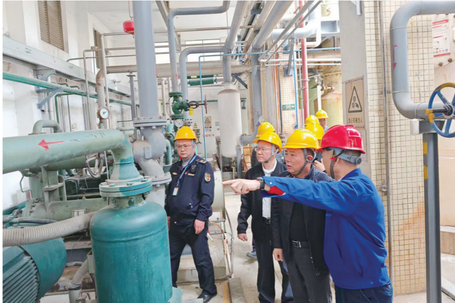
检查燃气场站安全生产工作

行“串瓶”；储存运输端，多在出租屋、闲置民居、货车车厢内非法储存，使用改装面包车、三轮车等普通车辆进行运输；销售端，通过便利店、水店、熟人介绍、发放小卡片、社交媒体（微信）等方式联系客户，提供“上门换气”服务，交易方式灵活且隐蔽。 （四）“黑气”滋生蔓延的深层次原因剖析。一是经济驱动因素。“黑气”与正规气之间存在显著价差，通常便宜20%-30%，这源于其逃避了税收、钢瓶检测、保险、员工培训等合规成本，背后的高额非法利润是驱动其铤而走险的根本原因。二是市场供给因素。部分区域正规瓶装气企业的配送服务网络覆盖不足，取消自提气后未及时充实送气工队伍，配送响应不及时，且需收取配送费，无法满足一些出租屋、小型餐饮用户便捷、经济的需求，为“黑气”提供了市场空隙。三是监管体系因素。对“黑气”经营行为的行政处罚力度与其高风险和高收益不匹配。基层监管力量薄弱，执法队伍人手不足，缺乏专业的调查办案力量和技术手段，难以应对隐蔽、流动的违法犯罪行为。四是社会认知因素。部分用户，特别是低收入群体和流动人口，安全意识淡薄，对“黑气”的巨大风险认识不足，为省钱而主动选择“黑气”。