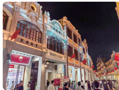
▲ 孙文西路步行街夜景