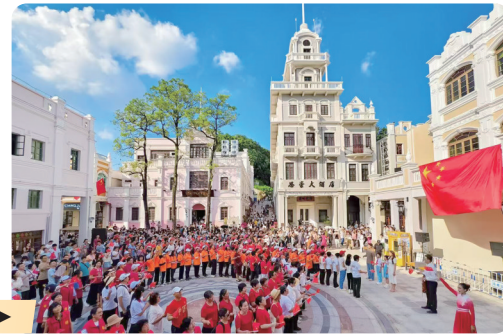
大庙下广场开展活动 ▶