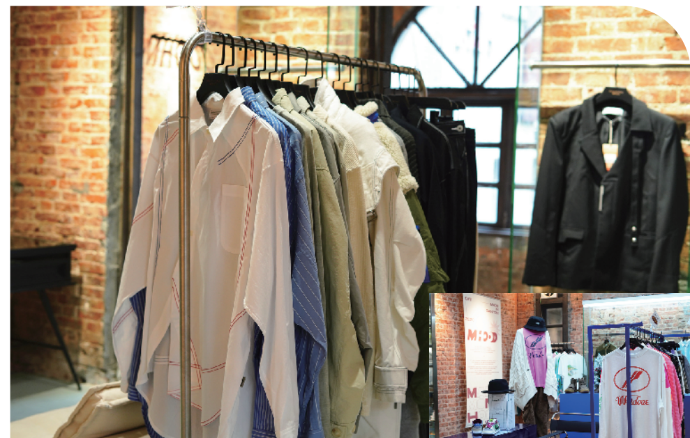
店内有多种风格服饰给顾客选择

店名: M-HOOD 地址: 海珠区工业大道革新路新民八街 36 号大板仓正门小洋楼 A 座 营业时间: 周一至周日 10:00-22:00