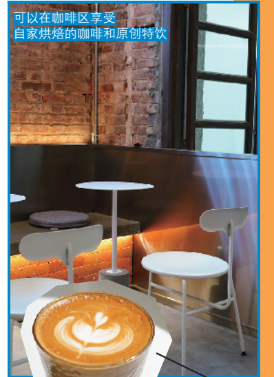
可以在咖啡区享受自家烘焙的咖啡和原创特饮

团队成员都非常喜爱日本文化, 店名中嘅“M”, 代表日语 Makimono, 意思是“卷物”, 希望传达“包容”嘅概念, 而“HOOD”係代表承载呢种理念空间, 但唯希望将门店打造成一个平台, 俾更多广州本土设计师、艺术家或文化传播者等人做展示, 期待将门店理念覆盖社区以至全广州。但唯仲好注重服务体验, 希望成为一间更有人情味嘅买手店, 令顾客来到都能够感受到店员嘅亲和。因为之前已经拥有第一间店, 所以都积累咗不少熟客, 但唯有时都会自觉嚟新店呢边一齐做咖啡杯测嘞!