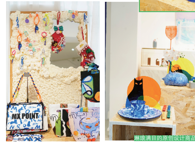
琳琅满目的原创设计商品