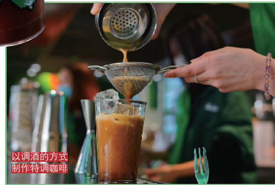
以调酒的方式制作特调咖啡

西关“急急脚”, 除环境设计上创意大胆, 但所带俾顾客嘅特调冰饮, 亦相当惊艳! 以 cocktail 嘅调制方式, 融合老广熟悉嘅食材与味道, 创作出多款特调冰饮。酸梅烧鹅咖啡、麻油清平鸡、冰皮月饼、咖喱鸳鸯……各种“古怪”风味冲击味蕾, 唔亲自试下真係估唔到实际嘅风味同口感! 人生在世咩都要试下, 呢种脑洞大开嘅 mix, 一定能够 surprise 到你! 如果你觉得呢 D 口味太“黑暗”, 呢度都有小清新风味嘅特调提供嘞!