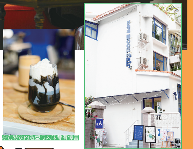
原创特饮的造型与风味都有惊喜

主理人希望可以嘅度, 打造一个城市里的歇息空间, 为大家展示生活嘅多种可能。除咗有多个工作室, 你会发现呢度嘅集合店区域, 放满咗多元化嘅原创设计商品俾大家选购。店内嘅陈列摆设、品牌商品都会定期更换, 为大家带来新鲜感! 呢度仲有一个小小餐饮区, 提供咖啡、原创特饮以及点心等等, 俾大家悠闲叹个下午茶。冬日里过来逛一逛, 享受笔墨人生、生姜拿铁等原创热饮, 感觉好写意嘞!