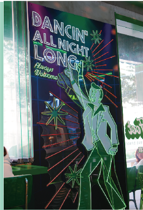
霓虹 neon 令人想跳舞!