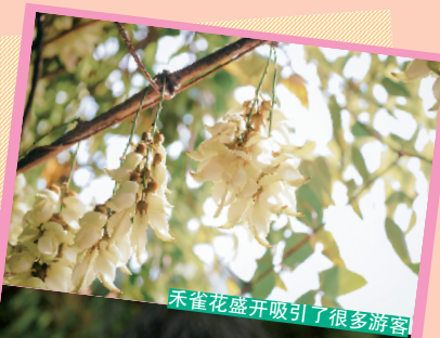
朱雀花盛开吸引了很多游客

正逢好时节,杜鹃园有着满山姹紫嫣红的杜鹃花,经过十几年的培育,这里的杜鹃花种类有约 150 个这么多,置身花海中,心情都异常美妙,就算分不清品种也不是那么重要了。