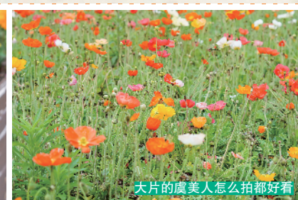
大片的虞美人怎么拍都好看