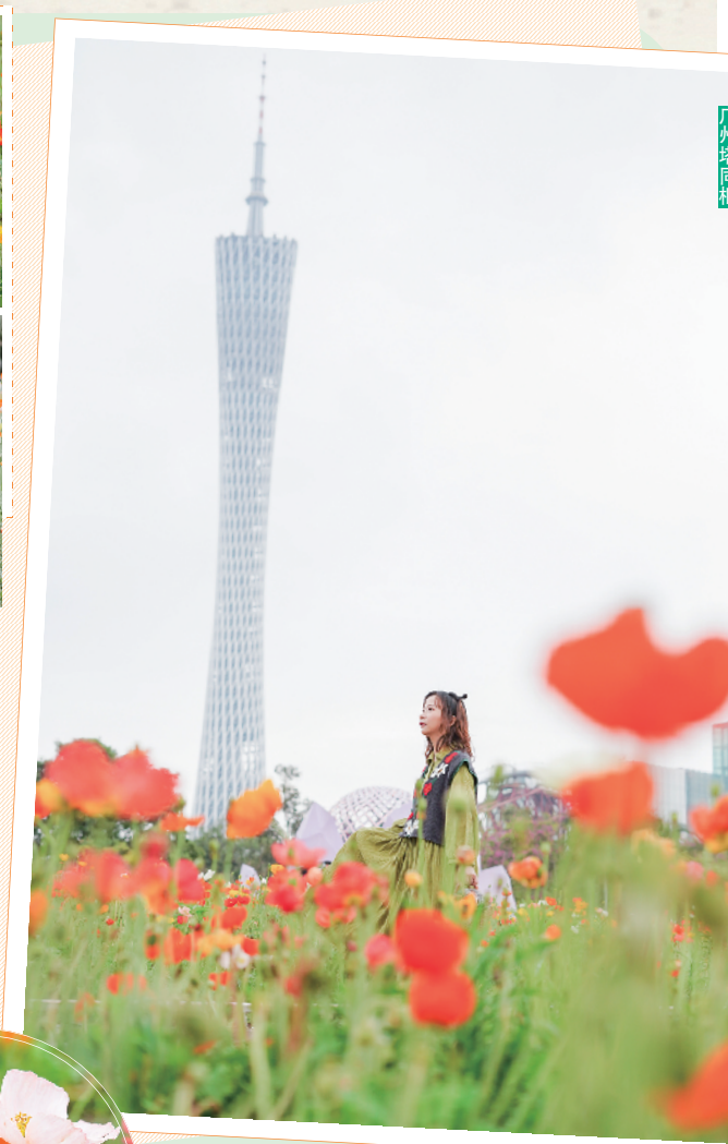
虞美人花海和广州塔同框

不仅是虞美人,在二沙岛上还有很多不同品种的花花,格桑花、孔雀草、醉蝶花等等,在沿江路上,还能看到大片的勒杜鹃,非常壮观。