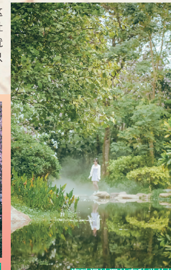
海珠湿地深处有秘境世外桃源感

今年名气很大的黄风铃,在这里也能看到踪影,还有茶花、勒杜鹃、满堂春等等,同样是一个公园就能观赏到多个不同的品种,门票只要 20 块非常划算。