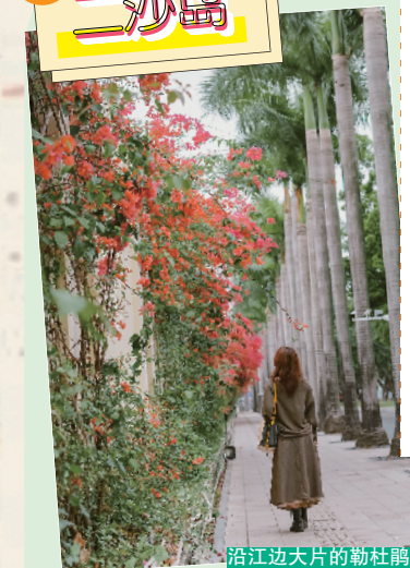
沿江边大片的勒杜鹃