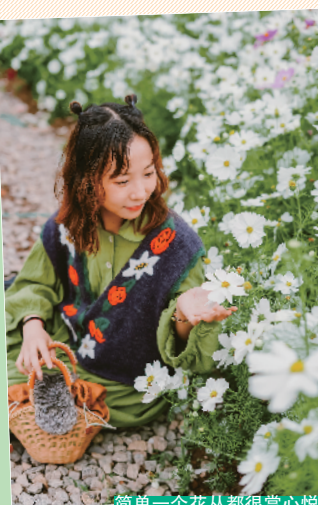
简单一个花丛都很赏心悦目

从地图上俯瞰,这个公园的布局像是一朵花一样,内有一大片花圃,根据不同的时节,会栽种不同品种的花供游人观赏,去年曾刷屏的向日葵就是来自这里,最近三月是非常受欢迎的彩色虞美人。虞美人的花朵颜色缤纷绚丽,简单地用手机也能拍出很优秀的照片,除了在市中心交通方便,免费开放也是这里吸引很多游人的原因之一,每逢节假日,花圃周围会聚集很多精心打扮的游人,错开高峰期会更好很多。