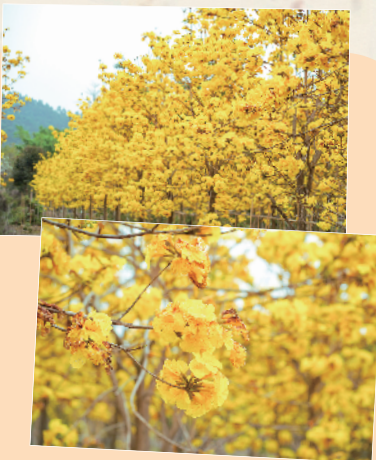
大片黄风铃有起,来让人感受舒适

不过黄风铃生长在高大的树上,想要拍出唯美的人像照,还是需要一些技巧和道具,自驾前往不妨带上凳子或是梯子,就能拍出角度完全不同的花花照。黄风铃的花期一直到三月底,而且广州南沙、番禺海傍、从化鳌头、佛山三水等地都有大片黄风铃,出发前记得查好攻略。