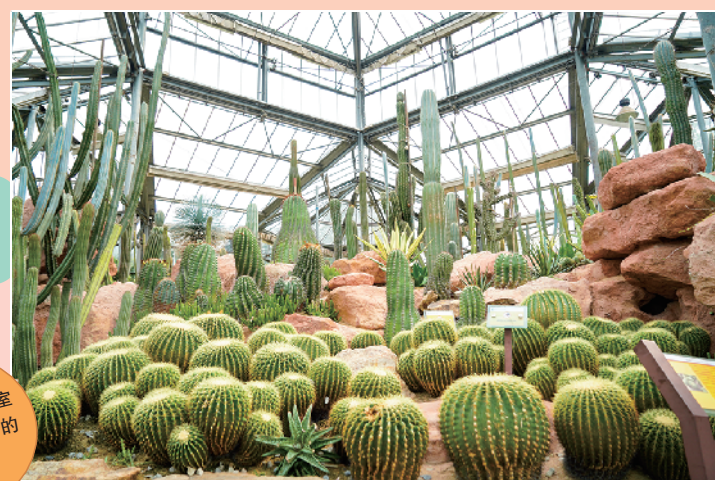
沙漠植物室都是耐看的仙人掌

暂时看腻了满目琳琅的花朵,植物园也有丰富的绿植区域供大家欣赏,其中温室区域的沙漠植物室是近年来很知名的网红景点,站在参天的仙人掌群面前,轻松可以拍出网红大片。普通区域的竹林、湖边的水杉也是很受欢迎的拍照点。在繁华的闹市里,这一大片遍布植物的园林,显得世外桃源一般,无论是一家大细还是三两好友,就算独自来访都很舒适。