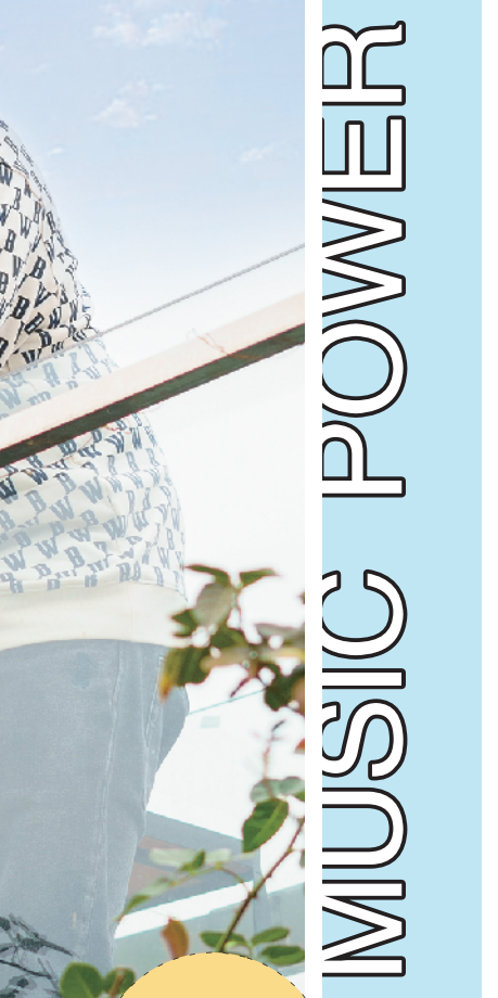
姚舜瑜 / 文、部分图 部分图片由被访者提供

他的灵感来源于自己嘅生活,同时自己亦经常会关注社会时事、学习历史,从中引发自己嘅思考。