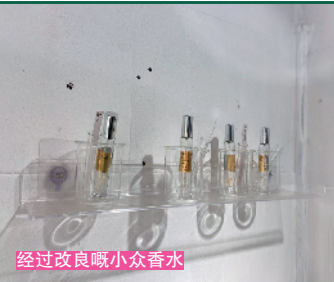
经过改良嘅小众香水

睇呢度，你可以试到唔同风格嘅植物香薰，以及佢哋手工调制出嘅嘅香水。如果呢啲唔啱你心水嘅，你仲可以试下佢哋改良过嘅小众香水，创意嘅香味之间碰撞，话唔理你会带住你意外嘅惊喜。