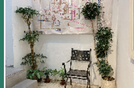
大家唔好嫌敬梓里店仔细小，行入去逛间睇，你会搵到无穷乐趣。