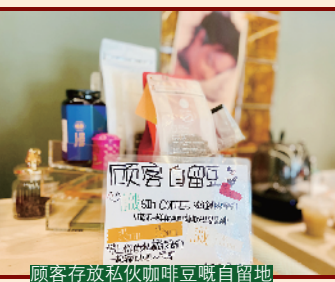
顾客存放私伙咖啡豆嘅自留地

饮品方面，SIK 大胆将岭南特色融合，炮制出古早龟苓膏咖啡、招牌糯米水……糯米水选用嘅糯米口感 Q 弹，口感清甜，天气热辣辣嘅时候整杯，消暑又祛湿，养生又滋味，唔少妈咪都忍唔住要买小朋友试下！想饮咖啡，SIK 呢度咖啡豆选择唔多，不过欢迎顾客自带咖啡豆过嚟磨，配埋招牌嘅芝士蛋糕，认真滋味！