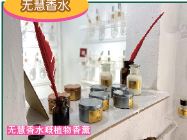
无慧香水嘅植物香薰