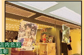
士家卫海报同店内色彩缤纷陈设相得益彰