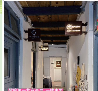
敬梓里一共有两层，一楼主要係独立设计品牌工作室