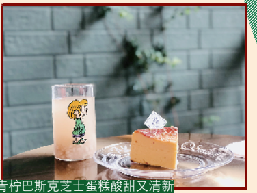
南村巴斯芝士蛋糕酸酸又清新