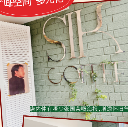
店内仲有唔少张张国荣海报，增添怀旧气息