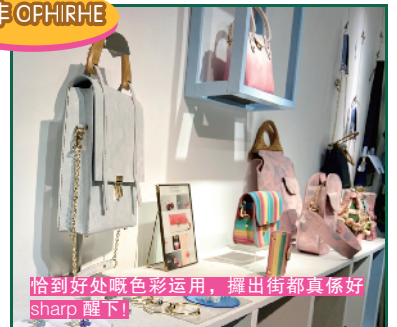
恰到好处嘅色彩运用，摆出街都真係好 sharp 嚟！

一行入店内，你就会见到好多好多彩色缤纷嘅皮袋。呢间叫 COLORFUL 嘅原创手作店，係由几位广美毕业生共同创立嘅，因为对颜色零舍敏感，所以佢哋就将呢种对色彩嘅追求，摆咗嘅佢哋设计嘅皮具当中。呢啲融合抢眼色彩搭配嘅手袋，每一件都係设计师眼中嘅艺术品。