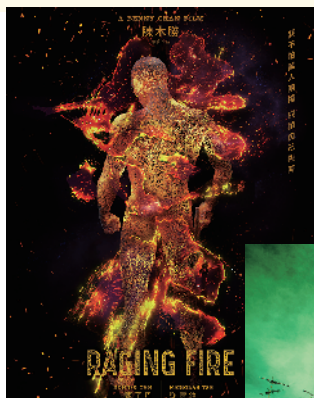
《怒火》 英皇影业有限公司，Bullet Films Productions Limited，导演陈木胜，监制陈木胜、甄子丹

喺电影行业，曾觅係剧照师，亦係海报设计师。对佢嚟讲，海报设计係融入咗设计师本身对电影嘅理解，会更具个人风格；而剧照嘅拍摄，同现场嘅环境、演员嘅表现、导演嘅论法都有好大关系，比较需要多方合作。不过无论係剧照定海报，曾觅每次都会全情投入，务求令每次嘅作品都以最佳嘅面貌示人，从中获取嘅满足感亦能 push 佢继续创作。