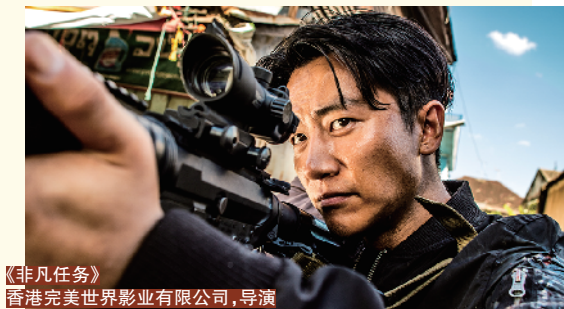
《非凡任务》 香港完美世界影业有限公司，导演 麦兆辉、潘耀明，监制黄斌

纵观成个中国电影史，若然要数当中某个重要嘅印记，相信一定会有港产片嘅身影。自上世纪七八十年代开始，经历紧“新浪潮”嘅香港电影，正逐步走向辉煌。题材包罗万有嘅港产片，塑造过无数经典，辉煌嘅背后，全赖一班热爱电影嘅香港电影人。《流光·飞影》2021 香港电影主题摄影展最近就喺广州 K11 展出，趁住今次机会，COLOR 专访咗两位同港产片关系密切嘅摄影师：卢玉莹同曾觅，带大家领略港产片嘅另一面。