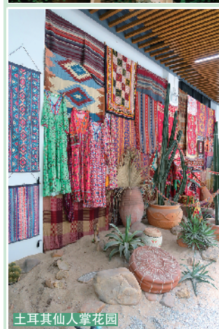
土耳其仙人掌花园