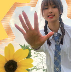
轻轻靠近向日葵 say hi