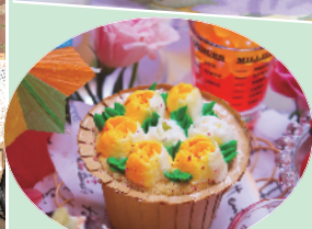
郁金香 cupcake 上层的奶油入口即化,下层是松软绵密的蛋糕。