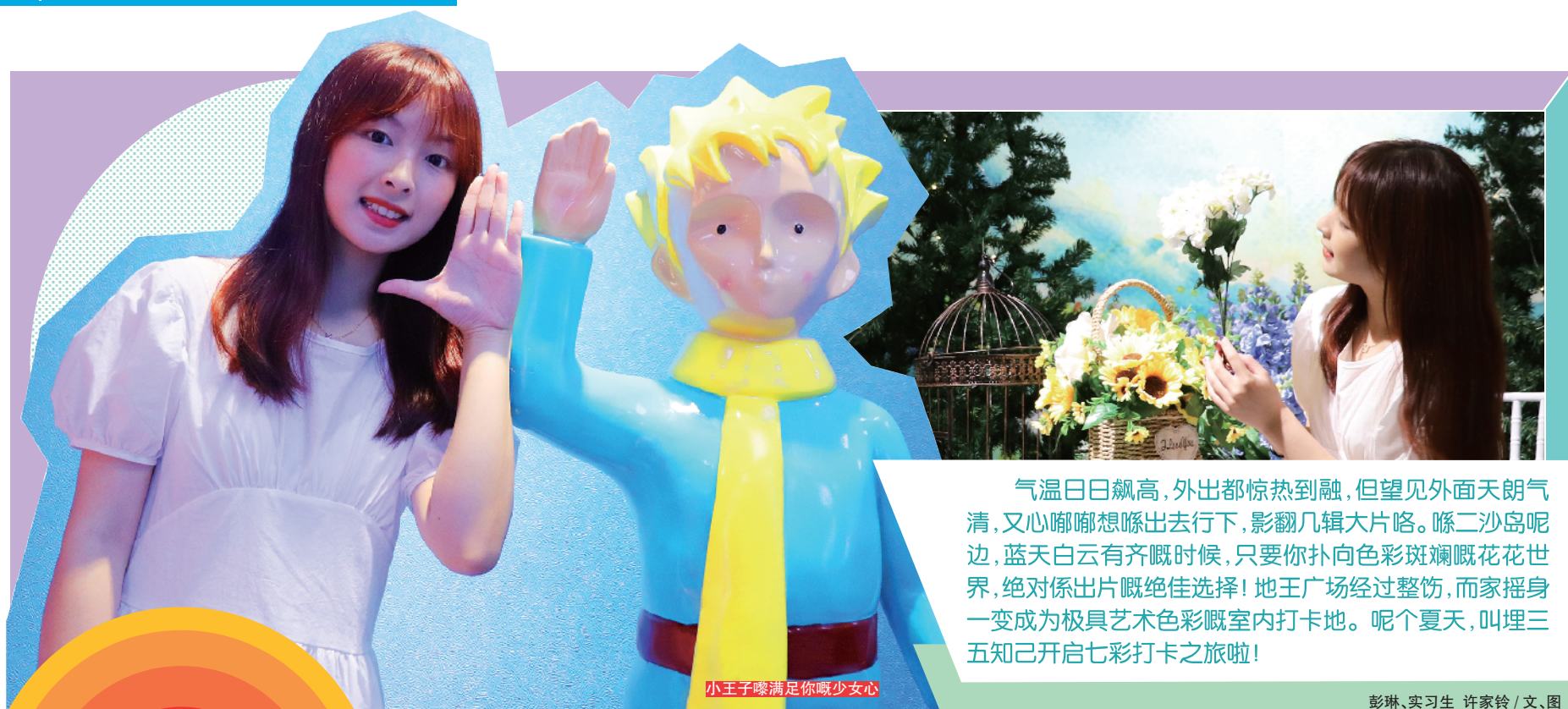
小王子嘛满足你哦少女心

气温日日飙高,外出都惊热到融,但望见外面天朗气清,又心嘟嘟想嚟出去行下,影翻几辑大片咯。睇二沙岛呢边,蓝天白云有齐嘅时候,只要你扑向色彩斑斓嘅花花世界,绝对係出片嘅绝佳选择!地王广场经过整飭,而家摇身一变成为了极具艺术色彩嘅室内打卡地。呢个夏天,叫埋三五知己开启七彩打卡之旅啦!