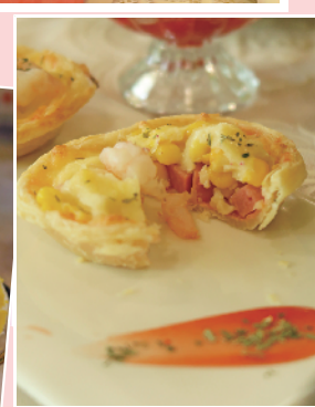
这款酥酥蛋挞上面是虾,里面是芝士、火腿和玉米,是下午茶套餐里会搭配的咸蛋挞,和其他甜品中和一下。