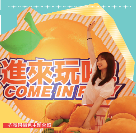
一齐嚟同橘色主题合照