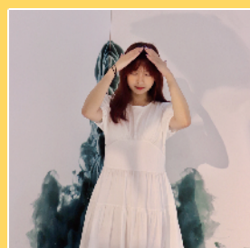
一城一字诗意打卡角

唔好以为打卡净係畀出片,呢度嘅打卡场景仲可以令你边学边影;汉字笔画、粤语文化、童话故事……阿妈问起都可以话“奉旨打卡”。学生哥时期嘅你,肯定有谗到一点一横都可以成为打卡点,镜头稍移动,墙角的泼墨渲染画又係另一番景象,学习都做唔一定要做“书虫”。想学啲盆盆文化,粤语就咁晒啦!呢块粤语打卡墙,最啱中意广府文化嘅你,打完卡包你随口噏可以当密笈!做得耐学霸,厌咗想转个style,“小王子主题”打卡位即刻令你秒变小公主,蓝色梦幻场地,加上对你微笑挥手嘅小王子,影完相之后仲会有想返煲(小王子)嘅冲动啊!学到嘢又影到靓相,一店一景、一城一字都意义不凡。