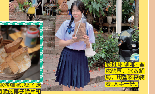
老挝冰咖啡:香浓醇厚、冰爽解渴,用塑料袋装着,人手一份。