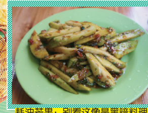
耗油芒果:别看这像是黑醋料理,入口,甜酸苦辣尽在舌尖蔓延。