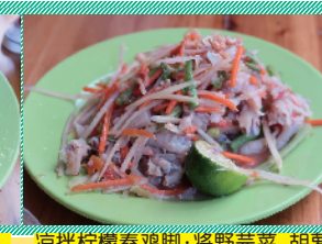
凉拌柠檬春鸡脚:将野茼蒿、胡萝卜丝、小米辣等食材捣鼓入味,最后挤上青柠提味。