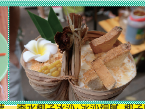
香椰子冰沙:冰沙细腻,椰子味香浓,还能吃到香脆的椰子脆片和椰肉,上面的面包片和玉米可以蘸着冰沙吃。