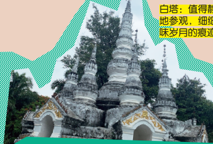
总佛寺 地址:云南省西双版纳傣族自治州景洪市告庄西双景 18 号 开放时间:08:00-19:00 (1 月 1 日-12 月 31 日 周一-周日)