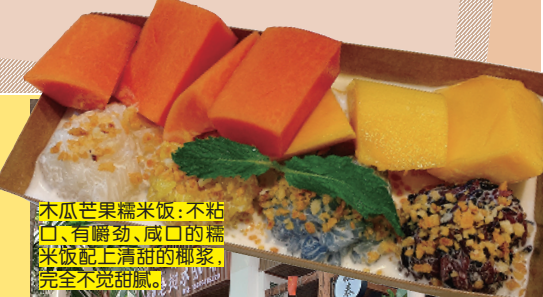
木瓜芒果糯米饭:不粘口,有嚼劲、成口的糯米饭配上清甜的椰浆,完全不腻。