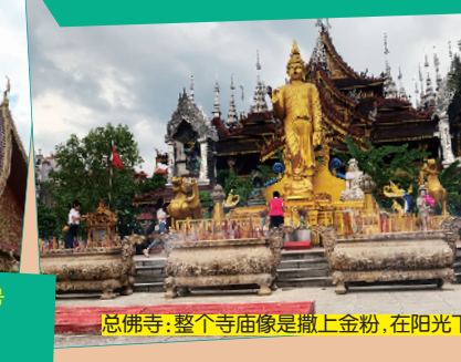
总佛寺:整个寺庙像是撒上金粉,在阳光下熠熠生辉