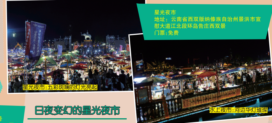
星光夜市 地址:云南省西双版纳傣族自治州景洪市宣慰大道江北段环岛告庄西双景 门票:免费