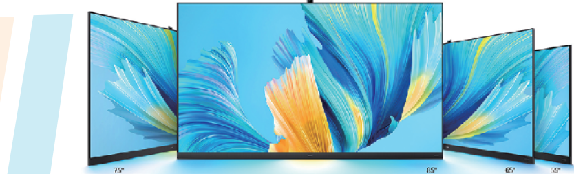
华为 matebook-vision 智慧屏