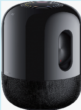
华为 sound-X 智能音响