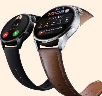
华为 watch3 智能手表