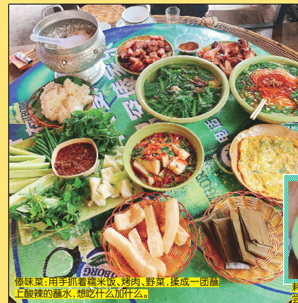
傣味菜:用手抓着糙米饭、烤肉、野菜,揉成一团蘸上酸辣的蘸水,想吃什么加什么。

最具傣式特色的就是傣味菜,傣家米线、烤鸡、烤五花肉、菠萝糯米饭、特色粳粑、炸牛皮、臭菜煎蛋、糯米饭和各种青瓜、香茅、野菜,配上不同的蘸料与蘸水,满满地摆上一桌,每道菜都地道而富有特色,分量十足。不拘小节的傣家人表示:“只有手抓才能吃到食物最原始的美味!”