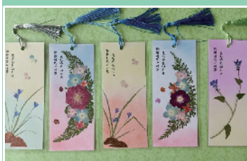
河北农业大学·花草书签

想要带走学校棵草留念?河北农业大学满足你!园艺学院校园“一草一木”,通过压花工艺制成书签,保留原汁原味母校气息。书签背面有每个毕业生名字以及学院党委书记向院长寄语签名。“聊赠母校一叶草,莫忘师生四行情”园艺人的浪漫原来是这样的!