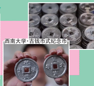
西南大学·古钱币式纪念币

西南大学材料与能源学院的多名师生为材料物理、金属材料工程两个本科专业嘅毕业生制作古钱币式纪念币。纪念章字样为“西南大学”、“材能学子”全部由师生们亲手制作,诚意呢项已经拿晒满分!