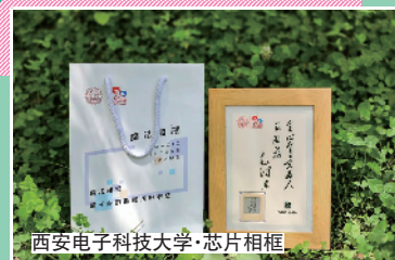
西安电子科技大学·芯片相框

西安电子科技大学准备嘅礼物就科技感十足!一个带有西电自主设计生产硅基芯片嘅魔法相框。相框无电池亦无需充电,采用墨水彩屏,通过手机NFC实现图片刷新输出。在手机APP上预设毕业生纪念图库,可根据时间推移随时展示母校变化。