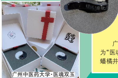
广州中医药大学·医魂双玉

广州中医药大学为全校毕业生送上黑白双玉一对,名为“医魂双玉”,白玉代表“虎踞杏林春日暖”,黑玉代表“龙蟠橘井泉水香”,两则都係“悬壶济世”典故。