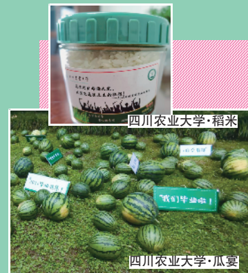
四川农业大学·瓜宴

四川农业大学表示:花狸花碌唔啱我,直接上瓜!其艺术与传媒学院设置一片“瓜田”,毕业生参加游园会,玩游戏赚取15积分,即可领西瓜,真·大型吃瓜现场。农学院嘅毕业生则会收到一罐米,呢罐米认真唔野少,係来自四川水稻育种界寄予厚望的品种——川康U2115。