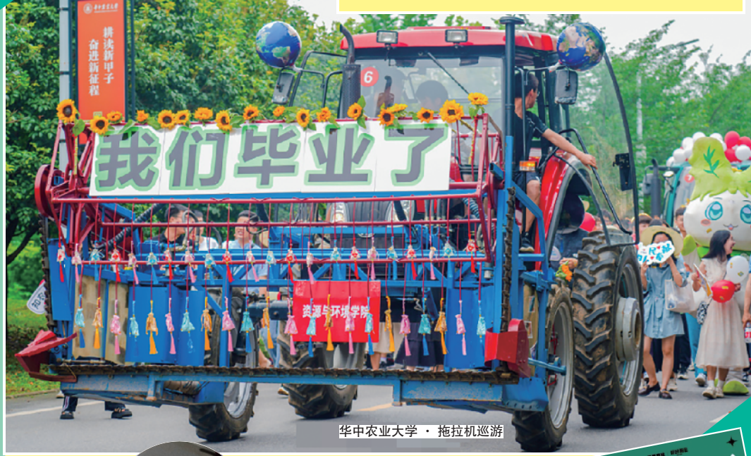
华中农业大学·拖拉机巡游

华中农业大学礼物够晒特别!每个学院装扮专属特色拖拉机,组成“钢铁长龙”顺校内巡游。此外,还有无人机表演、鼓阵表演和小提琴助阵,仪式感满分!