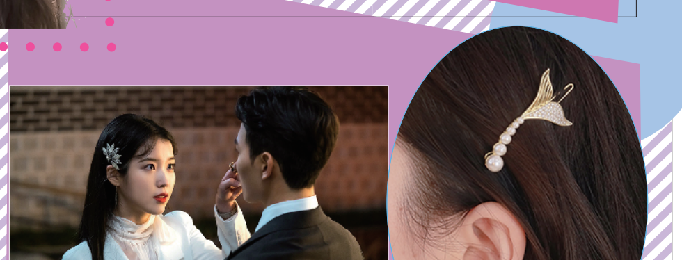
Early Sunset 人鱼之恋发夹