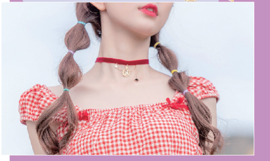
Pink Unicorn Curiouser Red choker