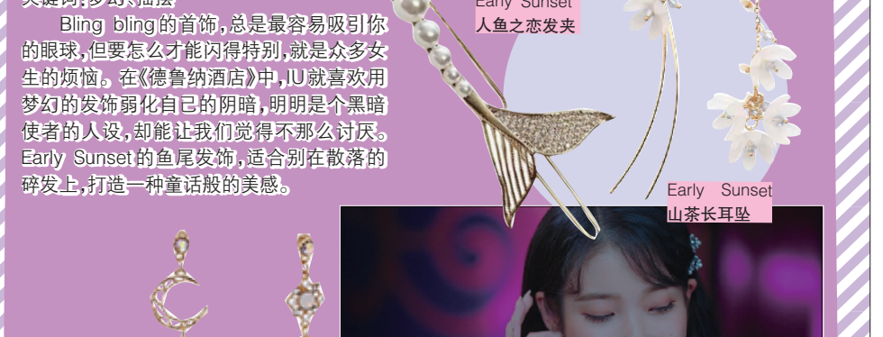
Early Sunset 月亮湖水耳钉