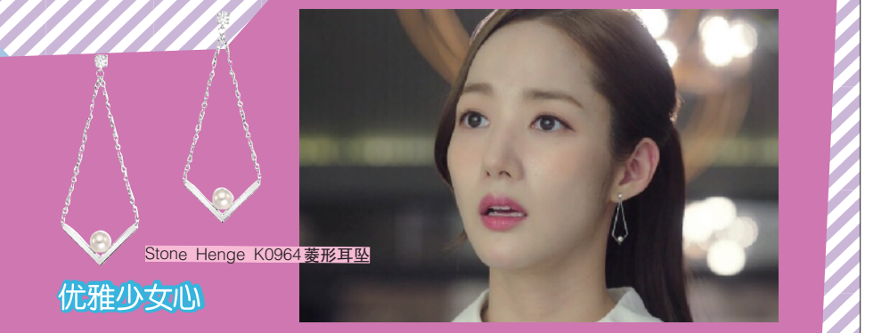
Stone Henge K0964 菱形耳坠 优雅少女心 关键词: 珍珠、贝壳