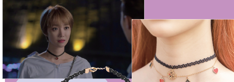
Pink Unicorn Curiouser Black choker