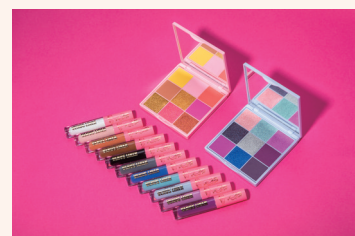
Lime Crime 维纳斯彩色眼线液笔&眼影盘

在舞台妆容里，彩色的运用很常见，今年眼妆上出圈的是高饱和度和高亮度的荧光色。化妆师不是做大面积的叠加晕染，而是用线条来塑造眼妆的轮廓，让眼妆看起来清爽又利落，还可以让整体妆容多一点点赛博朋克的未来感。这款妆容也刚好跟之前提到的裸妆很好搭，因为裸妆令面部其他部位的存在感比较低，眼妆就可以“跳”出来。