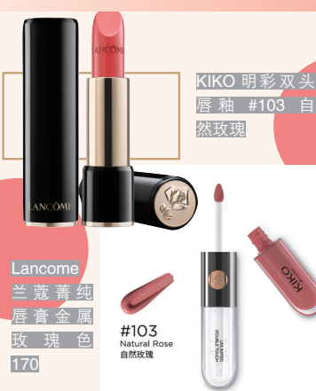
Lancome 兰蔻菁纯唇膏金圈玫瑰色 170