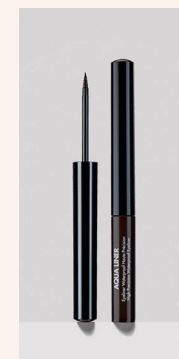
MAKE UP FOR EVER 防水炫彩眼线液