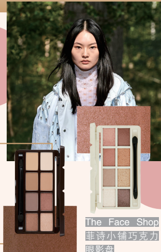
The Face Shop 菲诗小铺巧克力眼影盘

我们可以通过降低面部整体的粉感来突出皮肤质感，眼影、腮红、修容等等尽量用一些低饱和的粉色，美妆品选用偏膏状或者液体的产品，化出来的妆效会更加自然。