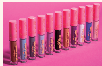
Lime Crime 维纳斯彩色眼线液笔