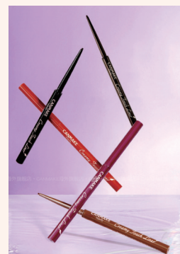
CANMAKE 井田日本 极细眼线胶笔