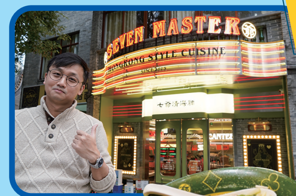
七爷清汤腩 猎德大道2号西浦大街1-13幢