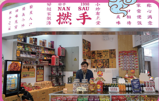
撚手饭堂[北京路店] 北京路168号天河城5楼b502