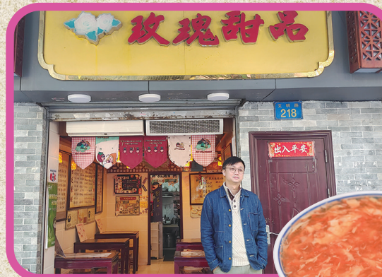
玫瑰甜品 文明路218号