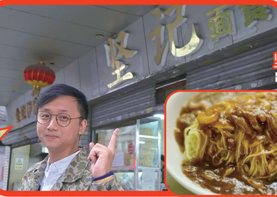
坚记面店 长寿东路303号

越荔湾俗称“西关”，有“一湾青水绿，两岸荔枝红”的美誉。上下九是广州三大传统商业中心之一，遍布吃喝玩乐各种店铺。近年政府全新打造的永庆坊，各式潮店与旧式骑楼建筑形成对比，极具特色与韵味，沿荔枝湾涌仲可至泮塘五约、沙面等打卡点，係让大家节假日可以打开闲逛、逛吃模式的好地方。