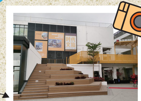
海珠同创汇 南洲街道新涌中路88号