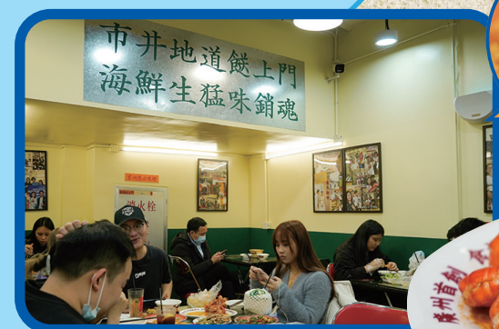
等我罾上門 天河南二路19号-21号宏发大厦一楼