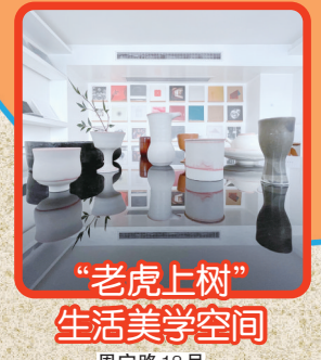
老虎上树生活美学空间 恩宁路18号