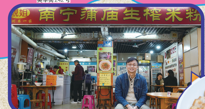
靓姐南宁蒲庙生榨米粉 英华街242号

海珠区位于广州中部，得名于珠江中的海珠石。海珠区曾因区内河涌密布，水路方便而成为重要的水路航道。好似海珠湿地被称为广州的“南肺”和“肾”，优美环境吸引热爱大自然嘅朋友争相打卡，附近仲有唔少旧厂改造嘅新晋网红景点。而江南西同琶醍，更是新一代Color粉丝打发时间与夜蒲的好去处。