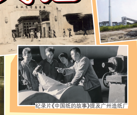
纪录片《中国纸的故事》提及广州造纸厂