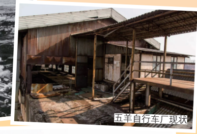
五羊自行车厂现状