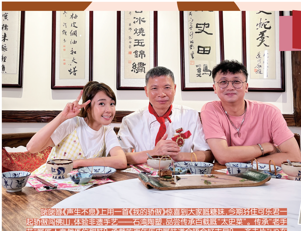
啱啱《声生不息》上用一首《我的骄傲》惊喜到大家嘅糖妹，今期仔住可乐君一起骄傲闯佛山，体验非遗手艺——石湾陶塑，品尝传承百载嘅“太史菜”。传承“老手艺”嘅匠人竟然係位甜妹？承载咗百年历史嘅味道会唔会好古早？一齐去片“UP在湾区”，即刻开启咗甜到漏嘅非遗之旅！