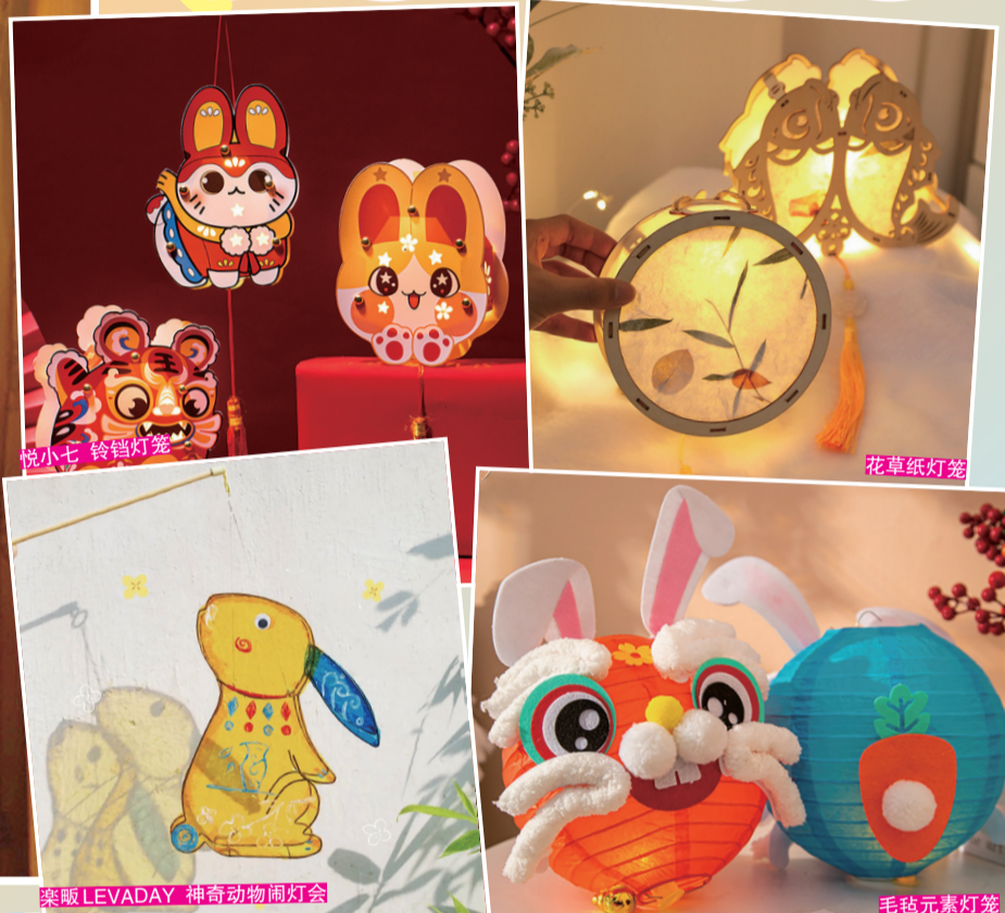
索威 LEVADAY 神奇动物灯笼会