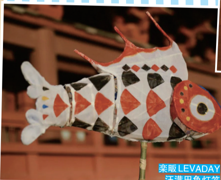
索威 LEVADAY 汪满田鱼灯笼