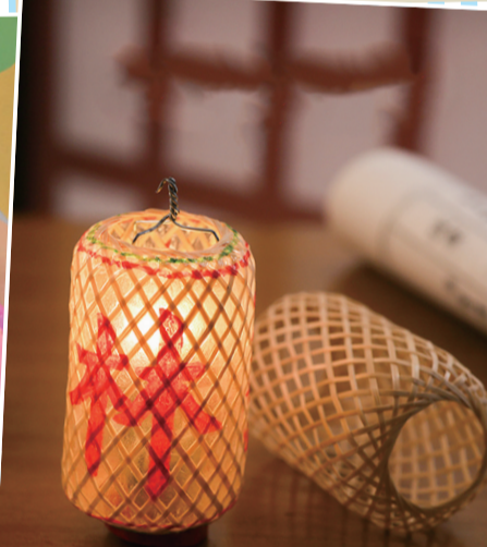
一世长安 潮汕竹编油纸灯笼 文字图案可自行设计(因为样板)