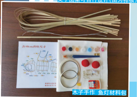
木子手作 鱼灯笼材料包