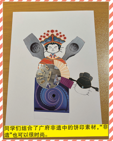
同学们结合了广府非遗中的饼印素材，“非遗”也可以很时尚。