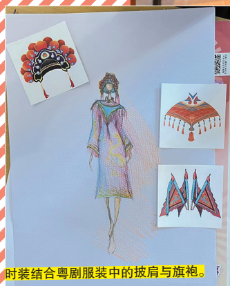
时装结合粤剧服装中的披肩与旗袍。