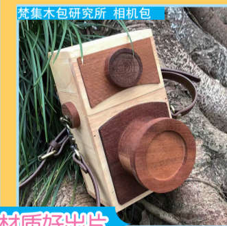
梵集木包研究所 相机包