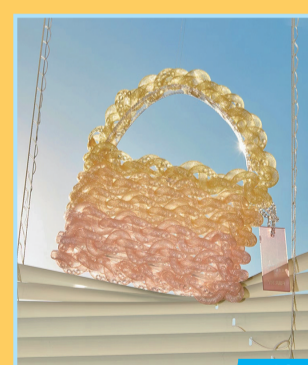
梵集木包研究所 朱古力包