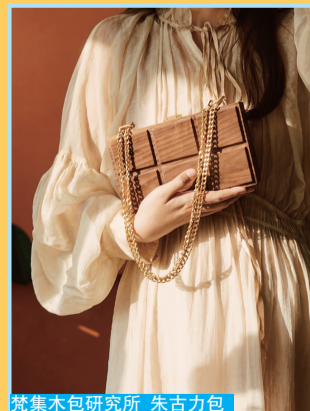
梵集木包研究所 朱古力包