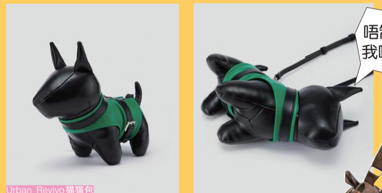
Urban Revivo 猫咪包