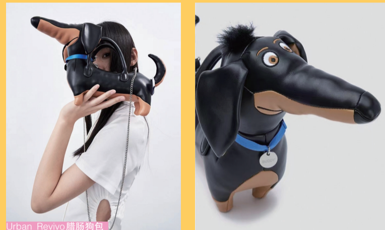
Urban Revivo 腊肠狗包