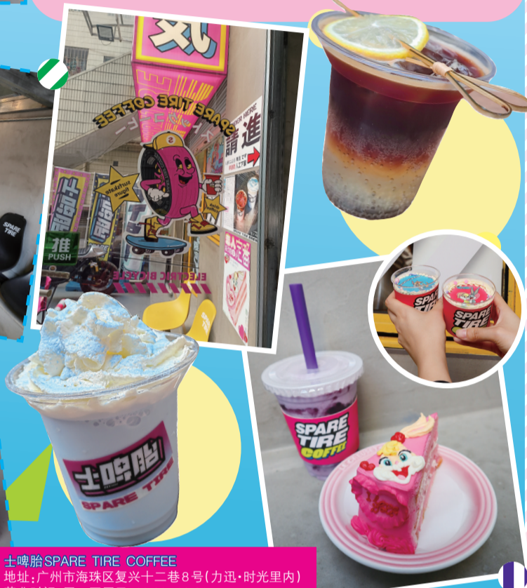
士啤胎 SPARE TIRE COFFEE 地址：广州市海珠区复兴十二巷8号（力迅·时光里内） 营业时间：周一至周五 13:30-23:30

正如店面布置，主理人韦恩本身十分喜欢机车、动漫、日系街头风等元素，不过佢希望店铺唔单单係将佢哋简单地照搬，而係融入自己的理解和改造，用更贴地气的方式将佢眼中有趣又够潮的日系街头风格，然后show在店里面。店内常设咖啡产品主要走大众路线，有深烘拼配豆同SOE单品豆可选，仲有芝麻冰、香芋冰等特色冰沙以及柠茶、热可可等其他饮品。店内主题和产品都会不定期更新，初春推出的融雪系列同bunny兔主题，颜色同店面好衬，好受顾客欢迎。