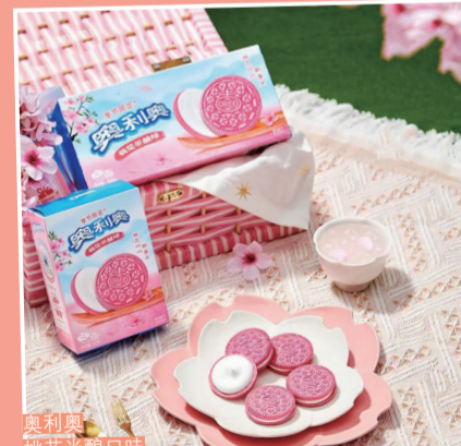
奥利奥 桃花茶点白桃味

粉嘟嘟的桃花同蜜桃，兼具颜值与风味，也係贩卖“春日气息”的流量密码之一！中国有不少地区，自古就有用桃花酿酒的历史，清冽甘醇的桃花米酿有好多拥趸嘞。唔少品牌就借呢款历经多年岁月考验的传统味道，打造专属桃花的春日限定盛宴。国风糕点桃花酥虽然不含桃花，但精致过人，高颜值让它一直稳坐春日茶点的C位。比起桃花，本身就係美食的蜜桃同零食就更加百搭啦。香甜不腻的蜜桃清新过人，芬芳果香在鼻头和舌尖萦绕，同松软糕饼、特调饮品、绵滑雪糕都特别啱key。