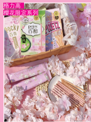
格力高 樱花限定系列