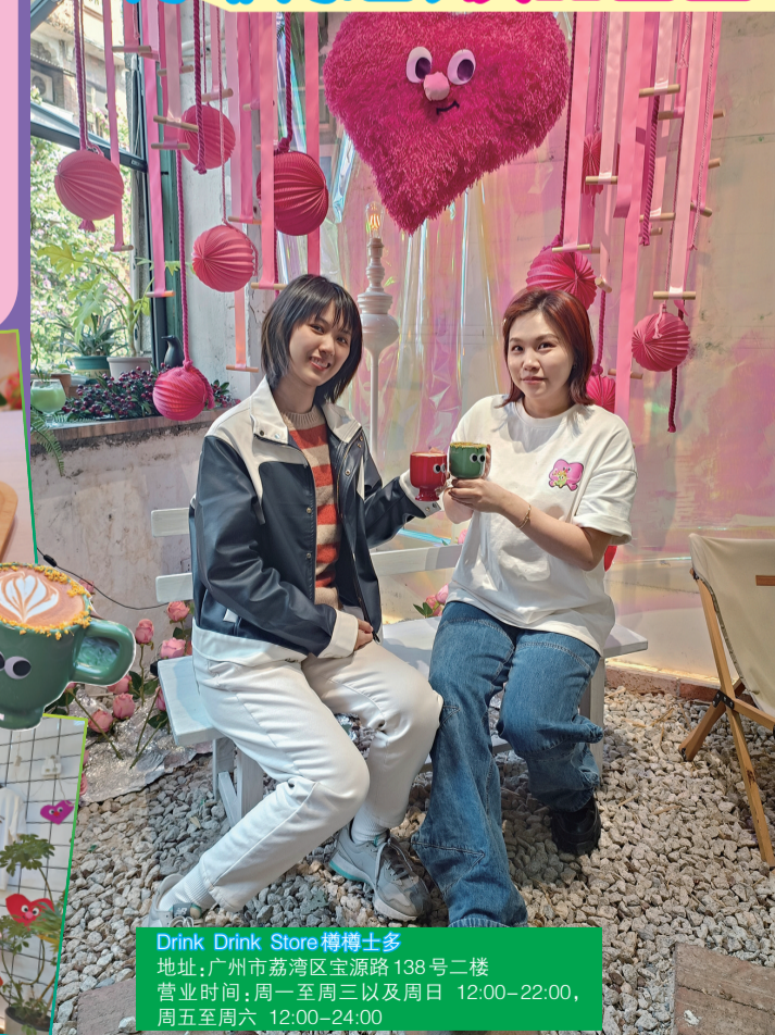
Drink Drink Store 樽樽士多 地址：广州市荔湾区宝源路138号二楼 营业时间：周一至周五以及周日 12:00-22:00，周五至周六 12:00-24:00