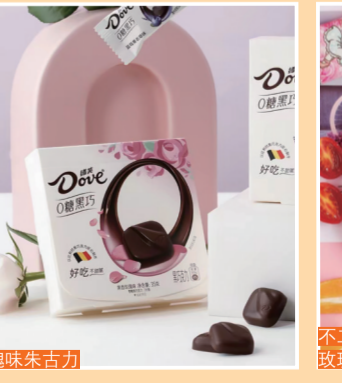
德芙 果香玫瑰味朱古力