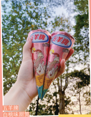
五羊牌 白桃味甜筒