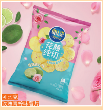
可比克 玫瑰青柠味薯片

自带浪漫气氛的玫瑰，都算係零食届的old fashion派“网红”啦。一讲起玫瑰零食，大家味净係谄到火遍大江南北的云南鲜花饼啦，其实薯片、朱古力、棒棒糖都可以有玫瑰味嘞。因为可食用玫瑰已经普及，大多数玫瑰零食亦会选择采用真玫瑰花瓣来做材料。论颜值，颜色艳丽、花瓣边度都好吸睛，用佢装点过的零食，斋睇样都好养眼了；论味道，玫瑰花有辨识度极高的独特香气，浓郁迷人，让人一尝难忘。颜值高、花香浓，有玫瑰元素的零食都好容易成为“爆款”。玫瑰花有自带浪漫、幸福的花语，用嚟表达爱意实有出戏，所以，玫瑰元素的零食，都好啱用嚟送人嘞，比起新鲜玫瑰花，睇的又食得，实用性先胜一筹。