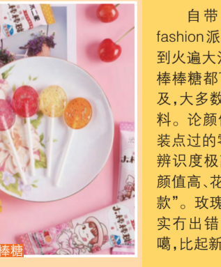
不二家 玫瑰花棒棒糖