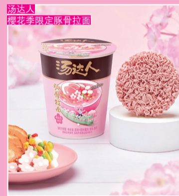
汤达人 樱花季限定感骨拉面