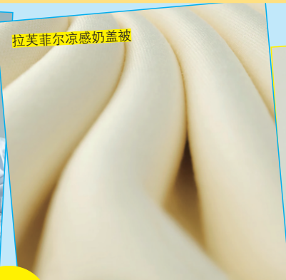
拉美菲尔凉感奶盖被