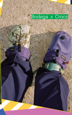
Bodega x Crocs