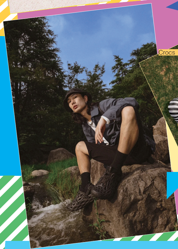
Crocs x Mschi