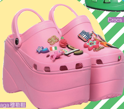
Crocs x Balenciaga 穆勒鞋

“身高唔够,鞋子来凑。”依家啲潮鞋嘅鞋底越来越厚,一键拉长腿部比例,从视觉上提高臀围线。巴黎世家同Crocs联名的“高跟版洞洞鞋”,把洞洞鞋增加细高跟,造型奇特,望落既唔舒适又唔优雅,令中意着高跟鞋、中意着洞洞鞋的朋友都沉默晒。不过,但哋推出的联名2.0版本、厚底洞洞鞋“Foam”,又符合返大众的审美啦。厚装鞋底膨胀到10厘米,真係矮个子嘅福音,鞋面再加啲五颜六色嘅得意logo做装饰,增加咗一份童真,着住显得成人都可爱啱。