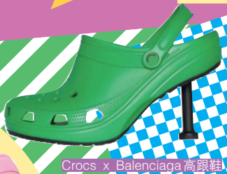
Crocs x Balenciaga 高跟鞋