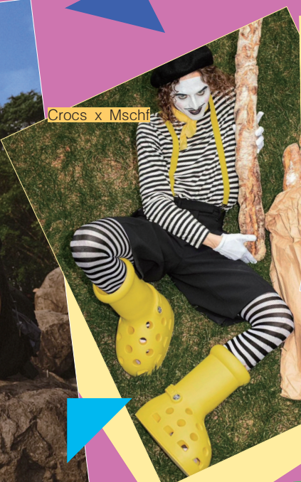
Crocs x Mschi