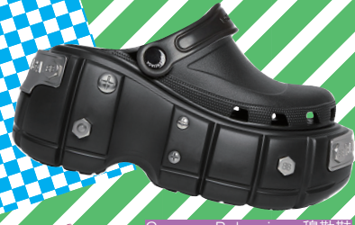
Crocs x Balenciaga 穆勒鞋