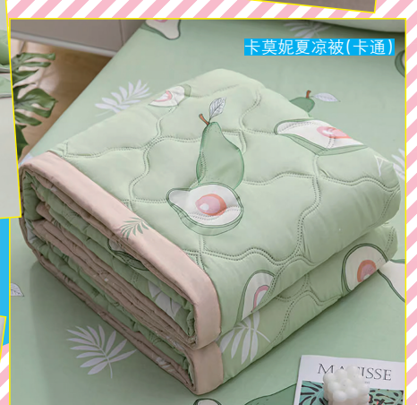
卡真妮夏凉被(卡通)