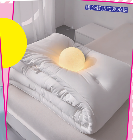
雕金虹超软夏凉被