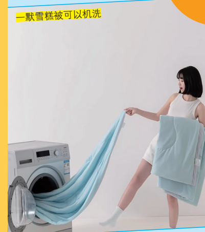
一款雪糕被可以机洗

每个人对凉感接受程度都唔同,冷气可以调温度,风扇有唔同的档位选择。论唔到夏凉被都好贴心,会根据大家肌肤的敏感程度,设计出不同肤感的被种。有触肤瞬间冰镇嘅夏凉被,最啱怕热易燥嘅“大汗星人”;用亲水纤维制作成被芯嘅凉被,更软糯亲肤,凉感和一啲,适合女生嘅体质;而蚕丝材质嘅凉感被,就适合俾小朋友用,透气舒适又唔惊冻亲。如果觉得被子太夸张嘅,可以拣小凉毯款式,比较款更轻薄小巧,唔晒打工人士办公室午休小憩时候用,披上身就得了。仲有一样好贴心嘅,夏凉被清洁简单方便,放入洗衣机,用普通衣物模式洗就得了,唔晒忙碌嘅打工人士。