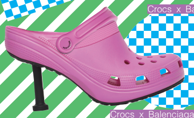
Crocs x Balenciaga 高跟鞋