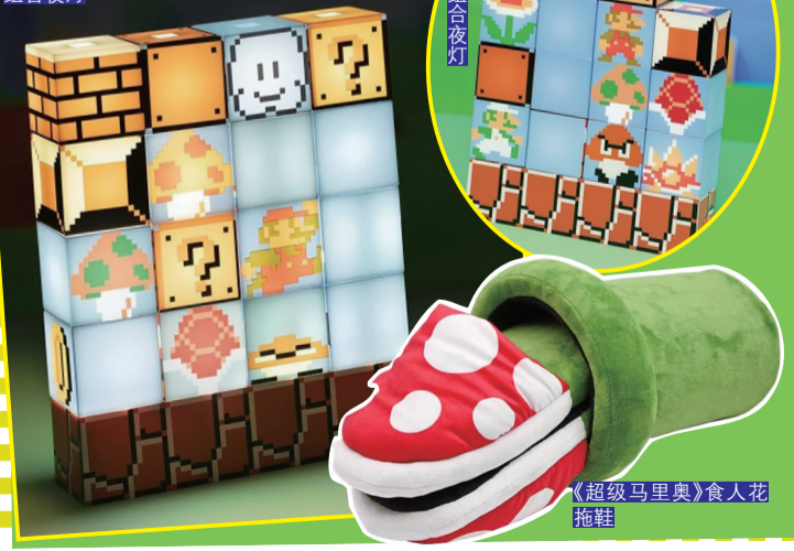
《超级马里奥》食人花拖鞋