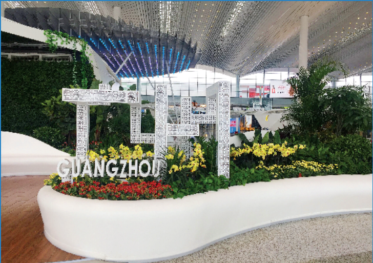
■白云机场2号航站楼有多个深受旅客喜欢的拍照打卡点,“天空舞台”是其中最出名的一个。