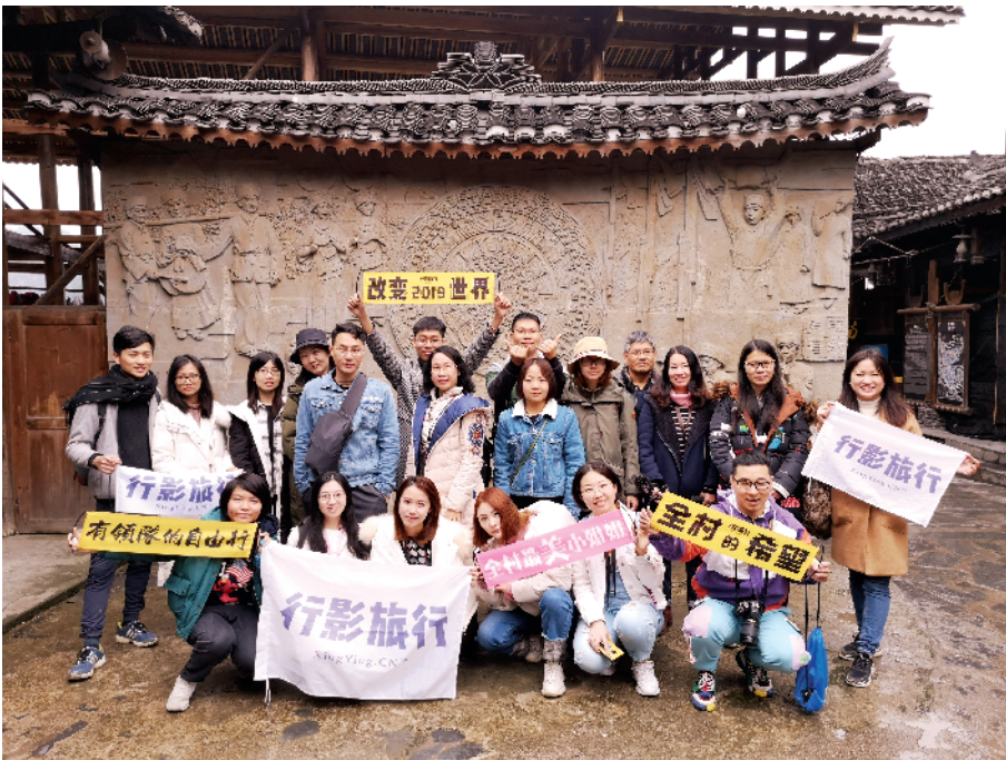
■咱们的领队已经找到最美景区,留影等您!

这是一次有领队的自由行,布排了各种超乎想象的有趣场景,观与赏的惬意自不必说,行走山水吃喝玩乐的同时,参团的您,还将成为助力脱贫攻坚的公益旅游的身体力行者。