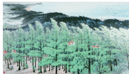
■关山月 绿色长城（纸本水墨）

目前，粤东粤西粤北地区“创森”行动全面均衡发展，县级国家森林城市、森林小镇、森林乡村等各层级森林系列创建活动蓬勃开展，广东省全域创建国家森林城市局面已全面打开。