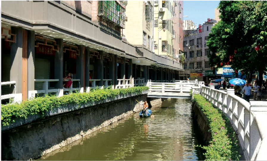
■揭盖复涌后的深涌中支涌(珠村段)一派广府水乡风情。