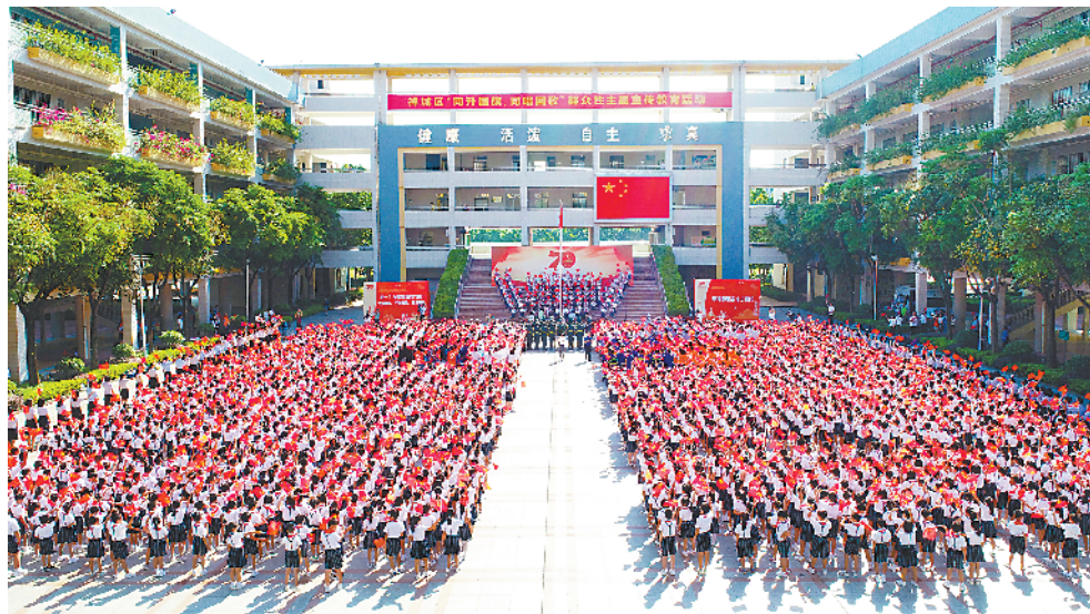
■全校师生参加升旗仪式。