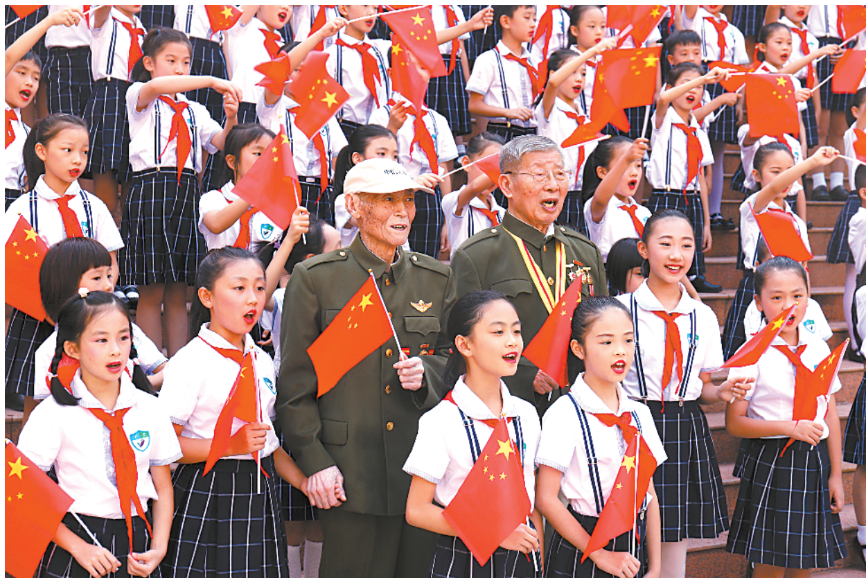
■全场合唱《歌唱祖国》。

今年是中华人民共和国成立70周年,随着国庆节的临近,近来及未来一段时间,佛山市及各区组织大大小小近百项主题活动。