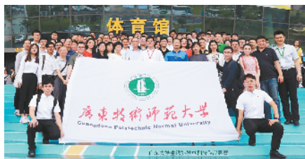
■广师大学生在国内外高水平学科竞赛中屡获大奖并多次捧得“优胜杯”“优创杯”。

助力广东职教收获这份荣誉的力量之一,是广师大为在职职教师资培训不断输血,为新的职教师资培养不断造血。作为全国8所独立设置的技术师范院校之一,广师大独具特色的思政教育体系、校企协同教学机制、学术科研水平在同类院校中有广泛影响力,不仅为广东职业教育做大做强提供师资基础,也为全国职教发展添砖加瓦。