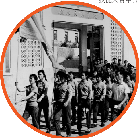
■1961年广东民族学院搬迁海南通什办学。

于祖国百废待兴之时筚路蓝缕建校办学,始终与国家民族同呼吸、共命运;到如今站在新的历史起点上,迎来新的发展机遇,广师大不懈攀登,未来可期。