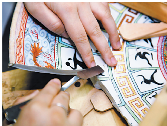
■艺术品修复师 Suzette 正在对破损的广彩瓷盘进行加固调整。