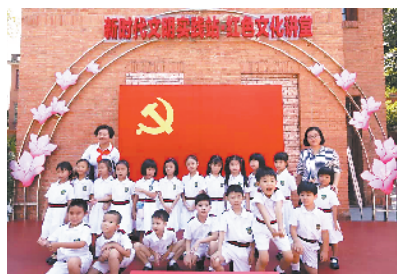
■朝天小学港澳子弟班小朋友来到中共三大会址纪念馆参观。