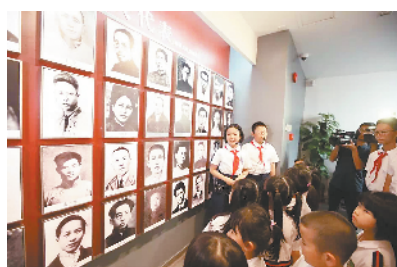
■培正中学港澳子弟融合班的同学实习当红色讲解员。