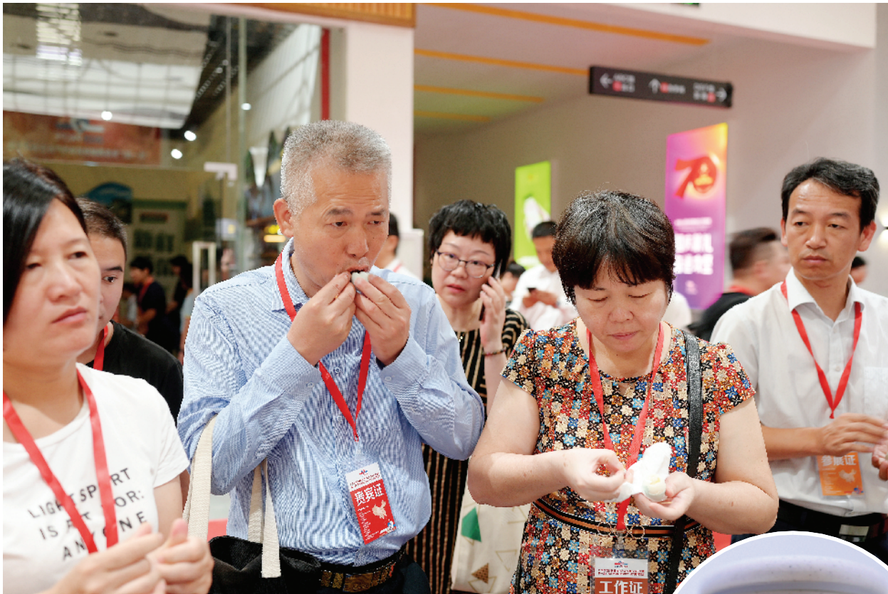
■重庆秀山妙泉湖的土鸡蛋吸引了不少市民驻足品尝。