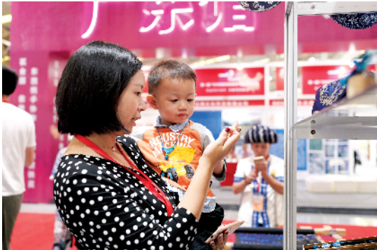
■参展商秦女士带着孩子逛展,被重庆苗族饰品吸引住了。

新疆红枣、清远盐焗鸡、西藏牦牛肉干……记者探馆发现,这里销售的产品涵盖茶叶、肉蛋、果蔬、粮油、药材超过100种,可谓琳琅满目。很多色香味俱全的农产品颇受欢迎,订单可观。