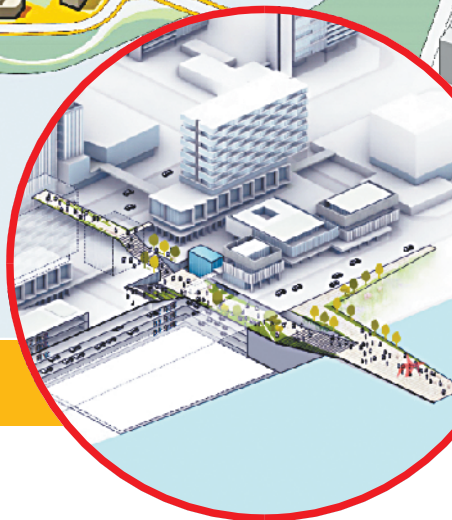
■白鹅潭二层观景大平台概念图