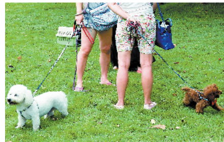
■狗狗们在二沙岛的草坪上秀萌。(资料图片)

付伟委员认为,属地街(镇)、居委会在指导小区成立业主大会时,要引导督促业主大会筹备组在管理规约中