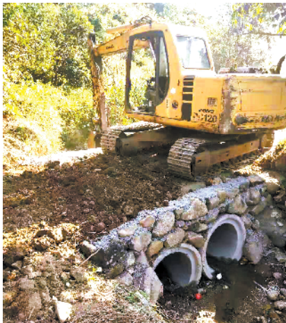
■ 秤架瑶族乡秤架村移民新村村道建设工程。