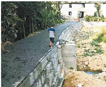
■ 秤架瑶族乡秤架村大坑水利建设工程。