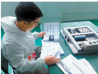
■进了“广汽班”,学习更有目标和动力。