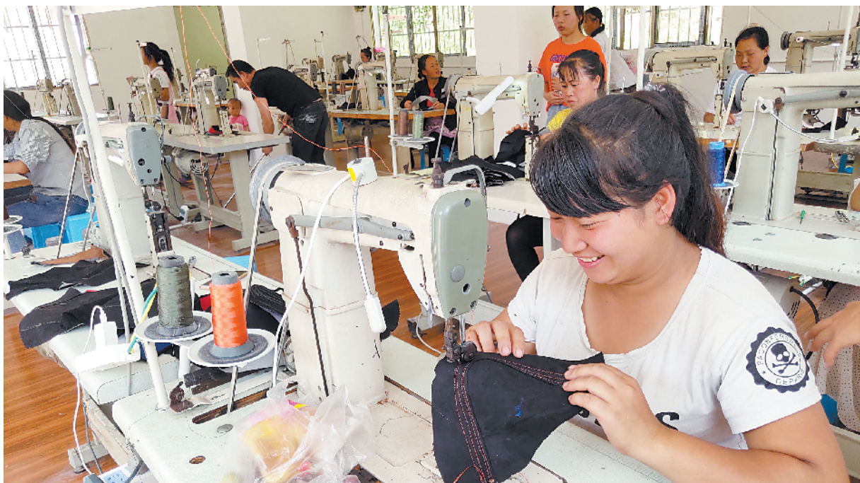
■广汽不仅投入资金援建了一个扶贫车间,还输出管理经验,帮助车间应对市场竞争。