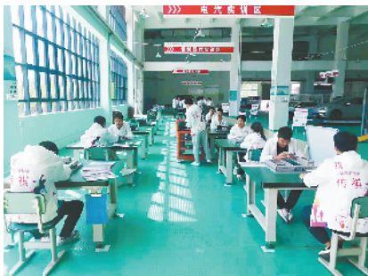
■第一期“广汽班”招收学员32人,其中7人是建档贫困户学生。

据介绍,援建“广汽班”的实训基地,广汽集团不仅提供了三辆汽油版和两辆最新电动版的汽车,还派内部讲师参与课程设计。学生自进入“广汽班”,就是作为“准广汽人”进行培养。通过2+1的教学模式,第三年送他们到广汽集团进行实训。“未来我们还要打造‘精品广汽班’,还会扩展到毕节职业技术学院老师们的职业培训,让他们也有更多机会到企业观摩学习。”贾文召说,广汽集团会从师资、软硬件、培训、就业等全方位进行帮扶,目前第一期“广汽班”招收学员32人,其中有7人是建档立卡的贫困户学生。