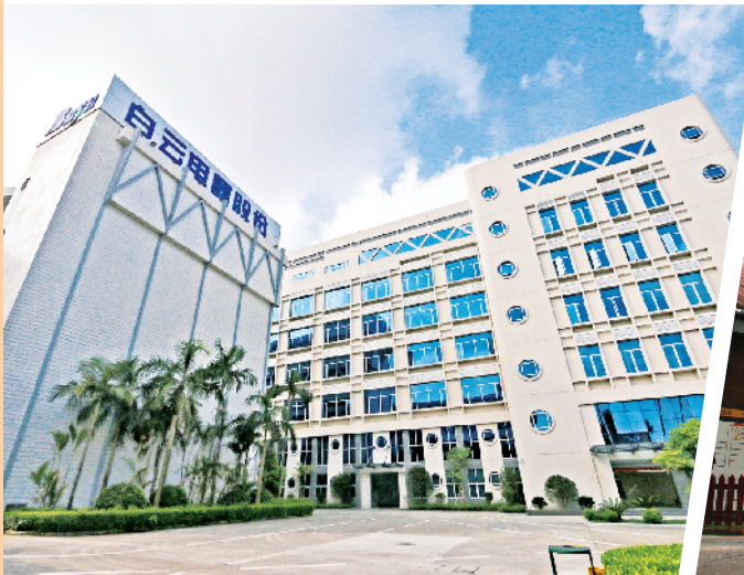
■白云电器的发展正是众多广州企业从“小作坊—低端工厂—先进制造业”的创新发展历程。

创新是企业持续发展的不竭动力。从打铁铺到地铁供电设备制造,白云电器成为了众多广州企业中,从小作坊华丽变身为先进制造业的一个典型。从零开始,发展到现今近两万人的国际互联网巨擘,网易创始人丁磊说“广州到处是网易发展的印记”。同样地,广州这片互联网企业的沃土,也见证了微信的成长壮大与创新飞跃。