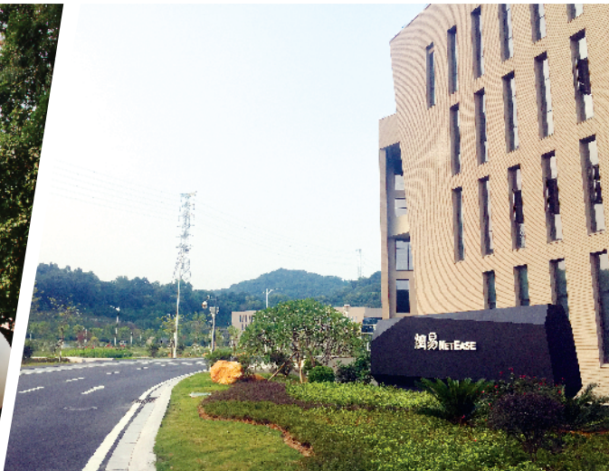
■网易总部二期项目位于广州天河区大观湿地公园旁,又名网易广州东湖研究基地,计划于2021年12月底完成竣工验收。