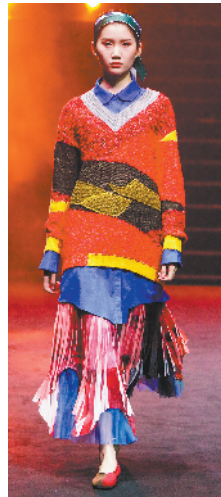
▲颇有特色的配色单品,经由长+长的混搭,别具飘逸之美。