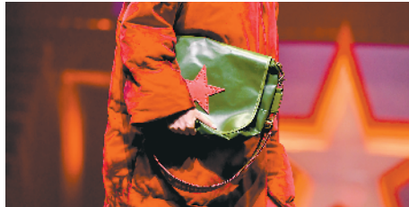
▲糅合了红星等元素的配饰在秀场中十分吸睛。