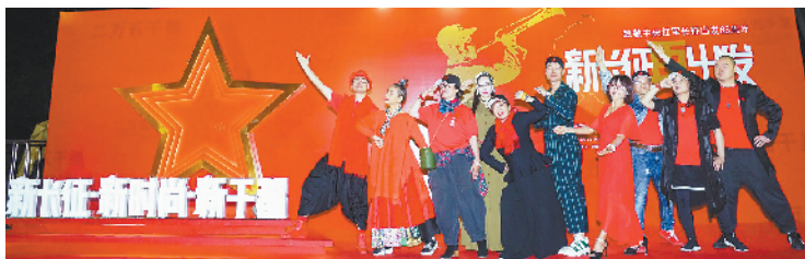
▲参与“以设计,致长征”项目的十位中国顶尖设计师。

10月17日晚,在微凉的晚风中,“新长征·再出发”于都时尚之夜在长征出发地江西省于都县风尚上演。