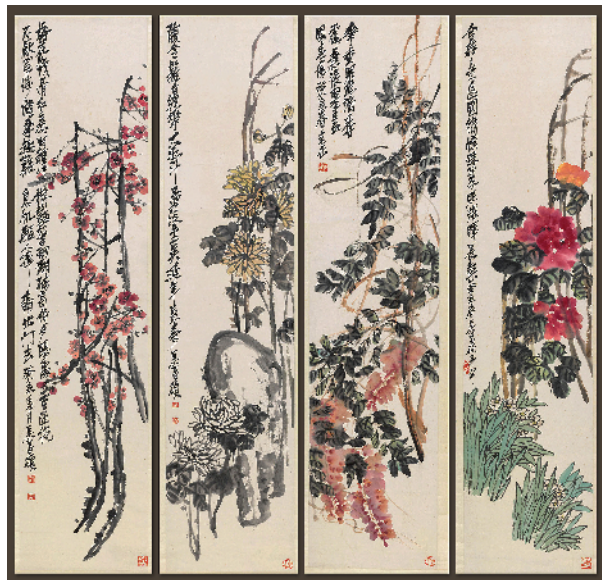
■吴昌硕 春夏秋冬花卉四屏