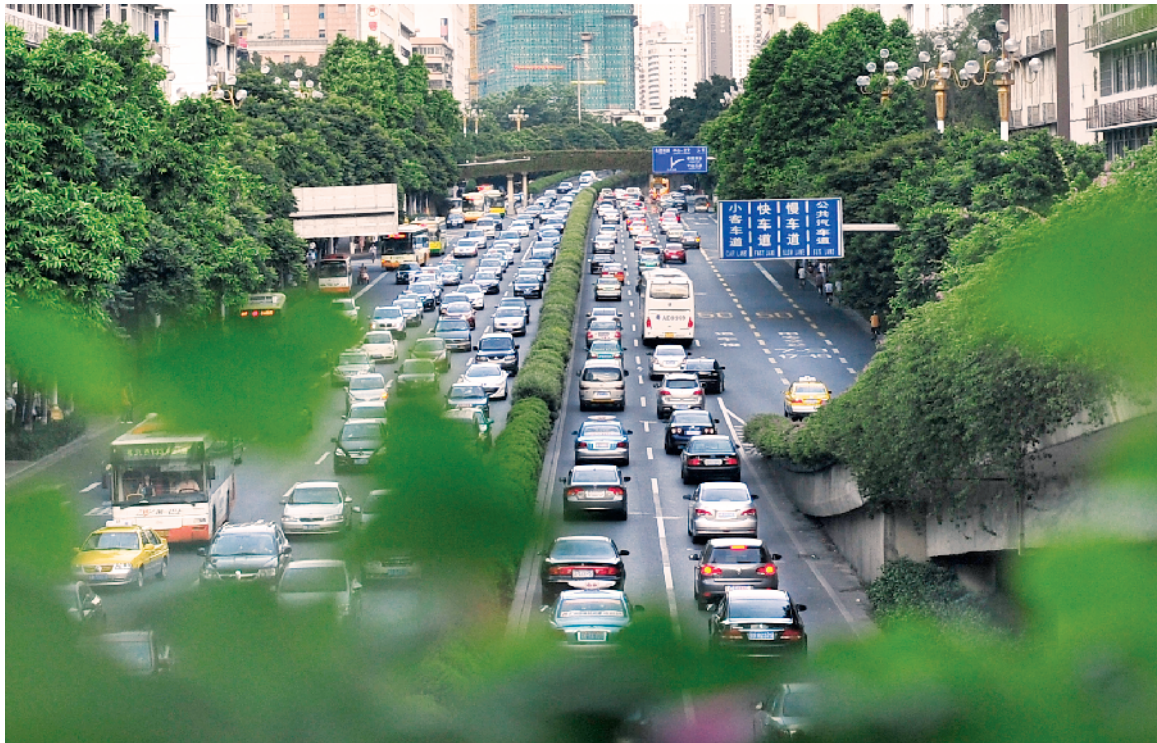
■广州车牌竞价价格下降至万元底价,但普通汽油版车牌号依然难摇。

广州市10月车牌摇号活动中,节能车中签率达100%。这与今年6月广州发布的增加车牌指标配置政策关系密切。《关于增加中小客车增量指标配置额度的通告》明确提出,从2019年6月至2020年12月,共增加10万个中小客车增量指标额度,其中节能车摇号增量指标额度增加5万个。原先个人节能车摇号指标为每月900个,政策发布后,6月的配置指标直接增至5400个。