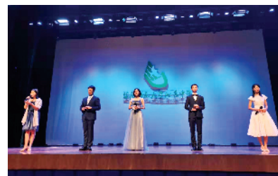
■成人典礼上,学生们当起主持人都落落大方。

新快报讯 10月26日,华南师范大学附属中学体育馆内气氛热烈,广州市第113中学2020届五山校区高三年级十八岁成人典礼在此举办。这是广州市第113中学五山校区托管给华南师范大学附属中学后的第一次大型学生活动。